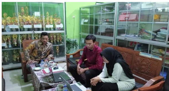
Sumber : (Dokumentasi Penulis, 2024) Gambar 2. Analisis dan Observasi di SLBN Purbalingga

Dalam melaksanakan proses analisis yang dihadapi oleh SLBN Purbalingga, maka disusun solusi permasalahan yang komprehensif dan berkelanjutan untuk memastikan keberhasilan program "Pelatihan Desain Grafis Bagi Anak Berkebutuhan Khusus Di SLB Negeri Purbalingga". Hasil observasi didapatkan bahwa secara umum siswa SLB sudah mendapatkan materi tentang penggunaan komputer dan beberapa diantaranya juga ada yang memiliki ketertarikan desain seperti mewarnai, menggambar, dan melukis. Hal tersebut tentunya dapat dijadikan dasar untuk memacu semangat peserta didik di SLB N Purbalingga untuk meningkatkan pengetahuan dan keterampilan di bidang desain grafis.