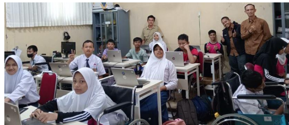
Gambar 3. Pelatihan di Ruang Kelas SLBN Purbalingga

desain, hingga pengembangan proyek kreatif yang dapat diaplikasikan dalam kehidupan sehari-hari dan juga produk di pasar atau bahkan industri menengah atau UMKM (Usaha Mikro, Kecil, dan Menengah). Siswa diajak untuk terlibat secara aktif dalam setiap sesi pelatihan, sehingga mereka dapat mengasah keterampilan teknis sekaligus mengekspresikan kreativitas mereka.