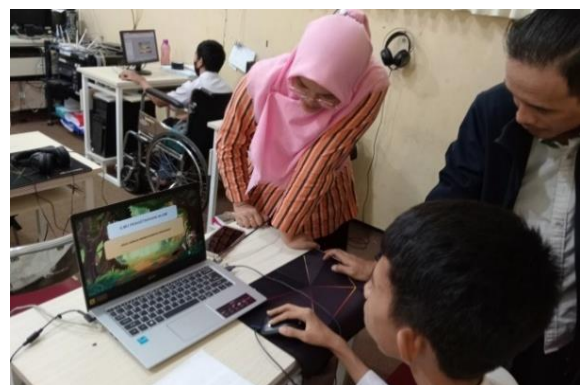
Gambar 4. Pelatihan Melibatkan Guru

Melalui pelatihan ini maka peserta didik mendapatkan manfaat [16], [17], diantaranya: