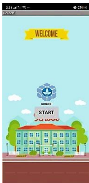
Gambar 2 Halaman Utama