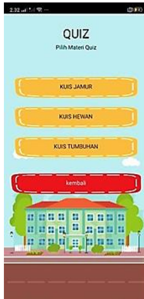
Gambar 5 Halaman Quiz

Aplikasi ini dirancang untuk meningkatkan pemahaman siswa terhadap konsep-konsep biologi yang rumit seperti jamur, tumbuhan, dan hewan. Hasil validasi menunjukkan bahwa aplikasi ini memperoleh skor System Usability Scale (SUS) sebesar 85, yang berarti aplikasi ini "sangat layak" di gunakan sebagai media pembelajaran.