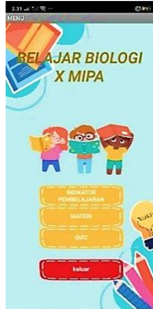
Gambar 3 Halaman Menu