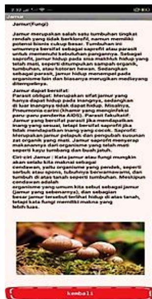
Gambar 4 Halaman Materi