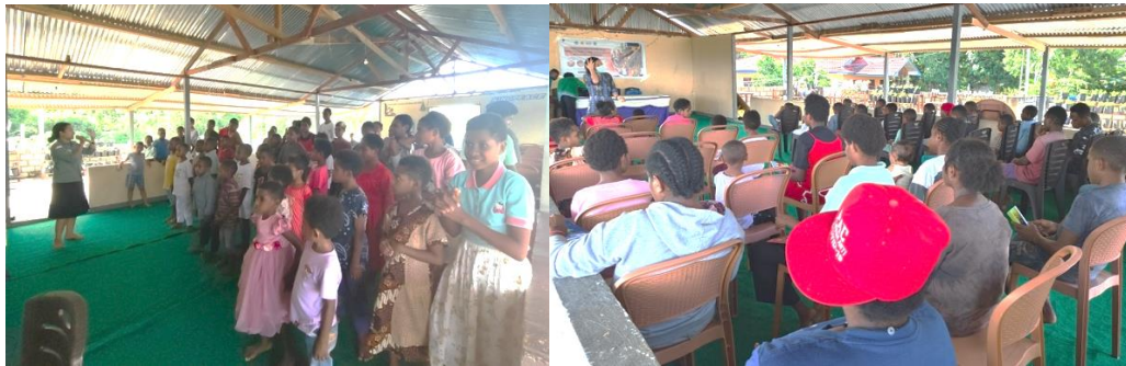
Gambar 2. Pelaksanaan Kegiatan Penyuluhan

Aktivitas penyuluhan yang disertai praktik langsung dan permainan edukatif terbukti efektif dalam meningkatkan antusiasme serta daya ingat anak-anak terhadap pesan-pesan kesehatan. Dengan demikian, penyuluhan kesehatan tidak hanya berfungsi sebagai media informasi, tetapi juga berhasil menjadi sarana transformasi perilaku yang mendukung upaya pencegahan skabies secara berkelanjutan di lingkungan panti asuhan.