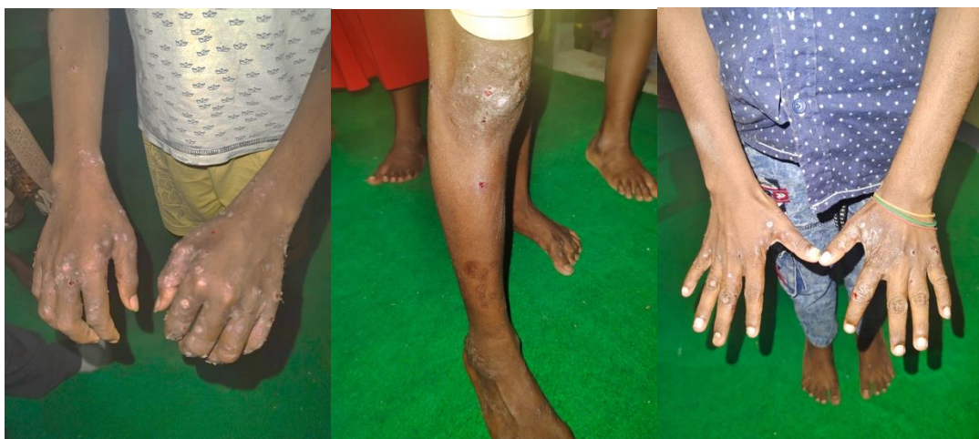
Gambar 1. Kondisi Kulit beberapa anak panti

Hasil penelitian menunjukkan bahwa Perilaku Hidup Bersih dan Sehat (PHBS) memiliki peran penting dalam mencegah penyebaran skabies di Panti Asuhan Holei Roo. Berdasarkan observasi awal, sebagian besar anak-anak panti belum menerapkan perilaku hidup bersih secara konsisten, seperti mencuci tangan sebelum makan, menggunakan handuk secara bersamaan, mandi dua kali sehari, serta mengganti pakaian dan sprei secara rutin. Hal ini menyebabkan beberapa anak mengalami gejala khas skabies, seperti gatal hebat di malam hari, ruam di sela-sela jari, dan luka bekas garukan. Namun, setelah dilakukan penyuluhan dan edukasi mengenai PHBS, terlihat perubahan perilaku yang cukup signifikan. Anak-anak mulai memperhatikan kebersihan pribadi mereka, seperti mandi secara teratur dan tidak lagi berbagi handuk maupun pakaian. Selain itu, para pengasuh juga berperan aktif dalam menjaga kebersihan lingkungan, misalnya dengan rutin menjemur kasur dan membersihkan lantai serta kamar tidur. Perubahan ini memberikan dampak positif terhadap penurunan gejala skabies di antara anak-anak panti dalam waktu dua hingga tiga minggu setelah penyuluhan. Dengan demikian, PHBS terbukti berperan besar sebagai strategi preventif dalam mengatasi skabies, terutama di lingkungan yang padat seperti panti asuhan, yang rentan terhadap penularan penyakit kulit akibat kedekatan fisik dan kebiasaan berbagi barang pribadi.