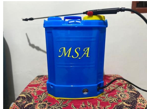
Gambar 2. Produk alat penyemprot disinfektan yang telah dimodifikasi pada bagian spray nozzle