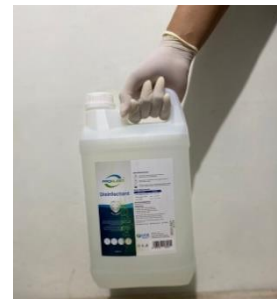
Gambar 4. Bahan baku disinfektan