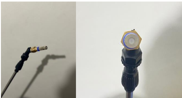
Gambar 3. Spray nozzle hasil modifikasi yang mampu mengeluarkan droplet berukuran kecil