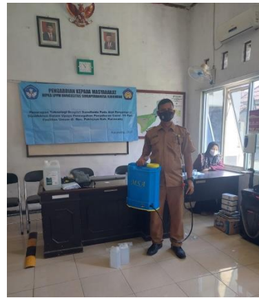
Gambar 6. Penyerahan alat penyemprot disinfektan dan bahan baku disinfektan