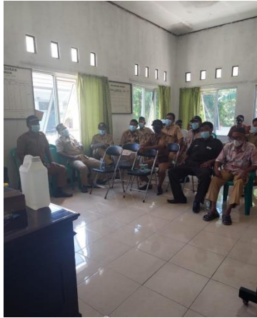
Gambar 5. Sosialisasi penggunaan, perawatan dan perbaikan sederhana alat penyemprot disinfektan serta metode dan prosedur pengenceran disinfektan.