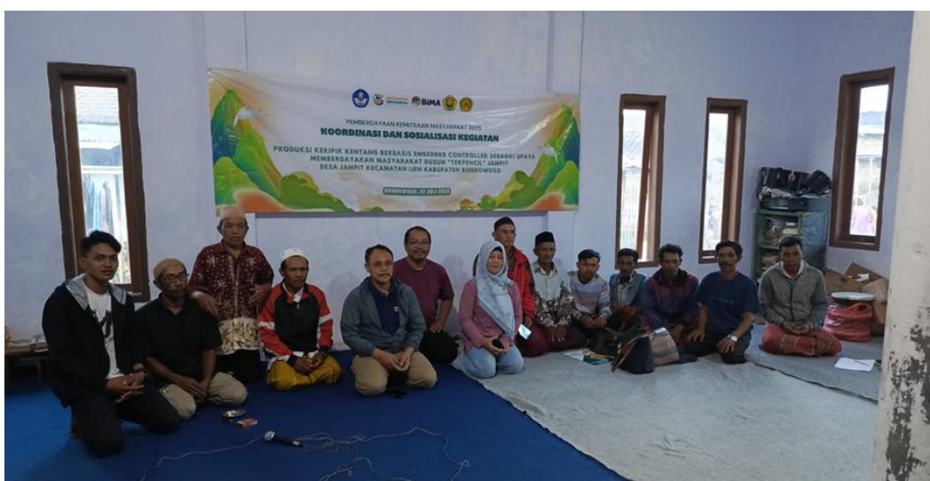
Gambar 2. Diskusi bersama masyarakat

Pelaksanaan kegiatan pengabdian kepada masyarakat dimulai dengan berdiskusi bersama masyarakat setempat, dalam hal ini utamanya kelompok pengajian PANCASONA. Kegiatan ini dilakukan di lokasi (dusun Jampit desa Jampit Kec. Ijen Kab Bondowoso) yang dimulai pada tanggal 27 Juli 2025.