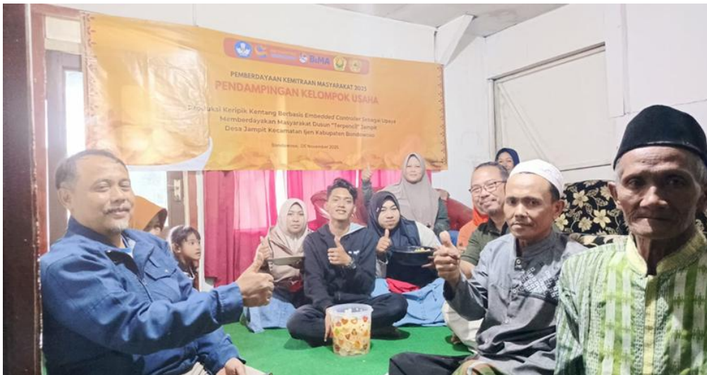
Gambar 7. Pendampingan pertama tanggal 5 Nopember 2025

Pendampingan pertama fokus pada pembahasan penggunaan peralatan setelah dilakukan pelatihan. Dalam kegiatan pendampingan ini para anggota yang fokus dalam produksi keripik kentang tidak banyak menemui kendala. Bahkan dalam pendampingan tersebut bagian produksi mengusulkan untuk mengembangkan dua varian olahan yaitu kerupuk kentang dan keripik kentang manis. Menanggapi usulan tersebut, tim Abdimas memberikan resep serta langsung melakukan pelatihan pembuatan kerupuk kentang dan keripik kentang manis. Sebagai hasilnya, para anggota produksi telah memahami resep dan secara terampil membuat kedua varian tersebut.