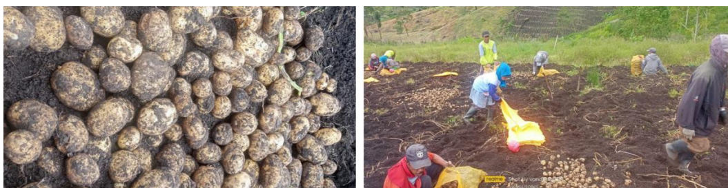
Gambar 1. Variasi ukuran kentang putih hasil produksi masyarakat dusun Jampit

Dusun Jampit, Desa Jampit, Kecamatan Ijen Kabupaten Bondowoso merupakan salah satu wilayah terpencil dengan potensi pertanian kentang yang sangat besar (BPS Bondowoso, 2025). Namun demikian, ketika hasil panen kentang putih yang berasal dari kemitraan dengan PT Indofood Sukses Makmur tidak memenuhi standar kualitas (grade) akan menjadi sisa panen yang tidak memiliki nilai ekonomis sehingga hanya menjadi limbah pertanian.