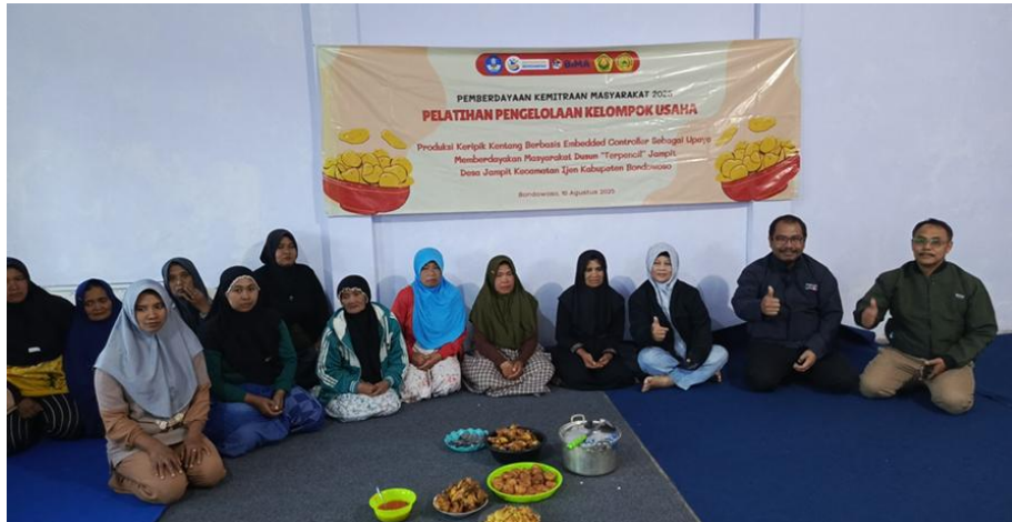
Gambar 3. Pelatihan pengelolaan kelompok usaha PANCASONA

Salah satu tujuan dari kegiatan abdimas ini adalah mendorong kelompok pengajian yang ada (yaitu PANCASONA) berkembang juga menjadi kelompok usaha. Kelompok usaha ini didominasi oleh kaum perempuan (remaja putri dan ibu-ibu) sebagai upaya membantu meningkatkan tingkat ekonomi keluarga dengan memanfaatkan produksi kentang yang tidak termanfaatkan. Pelatihan ini diselenggarakan di mushollah Al-Ikhlas Dusun Jampit Desa Jampit Kec. Ijen Kab. Bondowoso pada tanggal 10 Agustus 2025.