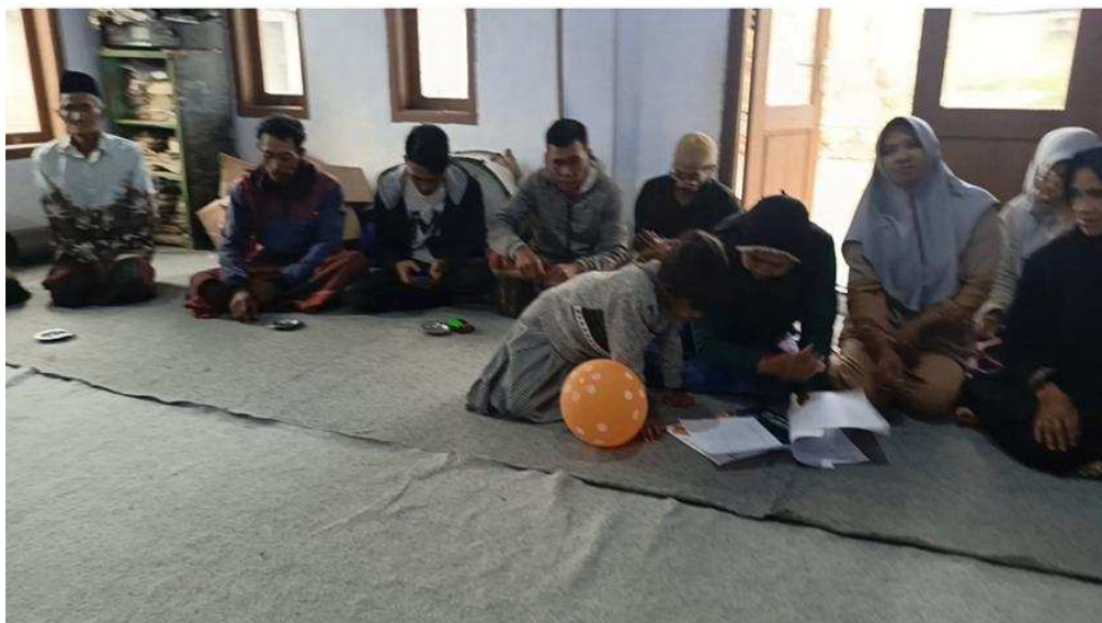
Gambar 8. Pendampingan kedua tanggal 10 Nopember 2025

Kegiatan pendampingan kedua dilakukan bersama bagian unit usaha yang fokus pada pengemasan dan penjualan. Tim Abdimas memberikan gambaran pengemasan makana yang baik serta potensi pasar yang ada. Pada proses pendampingan para peserta sudah berhasil menyepakati desain kemasan yang diinginkan serta logi yang digunakan. Dengan adanya desain kemasan dan logo tersebut saat ini Masyarakat dusun Jempit Desa Jempit Kecamatan Ijen Kabupaten Bondowoso telah dapat memulai memasarkan produk keripik kentang putih yang mereka hasilkan.