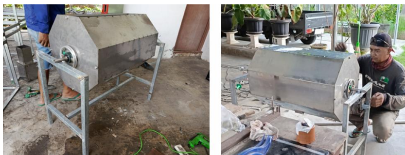
Gambar 4. Pembuatan tabung mesing pengering keripik kentang putih

Tabung pengering bahan keripik kentang didesain menggunakan stainless steel dengan alasan bahan tersebut aman digunakan untuk pengolahan makan (Mujumdar, 2014; Fellows, 2017). Untuk membolak-balik bahan keripik kentang, tabung pengering tersebut dibuat secara horizontal dengan menggunakan as berupa pipa sebagai poros tabung (Bala, 2016) dan mengalirkan udara panas. Mesin penggerak tabung tersebut didesain menggunakan motor yang dihubungkan dengan pully yang dilekat di samping tabung.