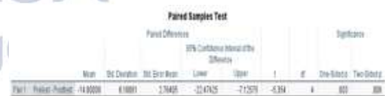
Gambar 1.2 Hasil Uji T

Setelah melakukan perbandingan antara skor angket sebelum intervensi dan skor angket setelah intervensi maka langkah berikutnya untuk menentukan apakah intervensi yang diberikan memberikan dampak signifikan maka dilakukan Uji Paired T-test menggunakan bantuan IBM SPSS, berikut hasil uji T-test peningkatan efikasi akademik peserta didik: