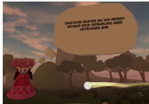
Figure 3.1.2 Trail Effect penunjuk rotasi kearah peri