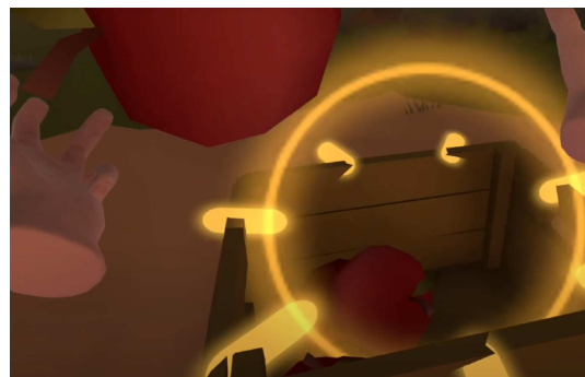
Figure 3.1.4 Ledakan (flash) saat memasukkan apel kedalam box