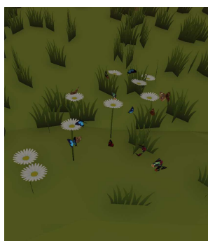
Figure 3.1.7 Kupu-kupu