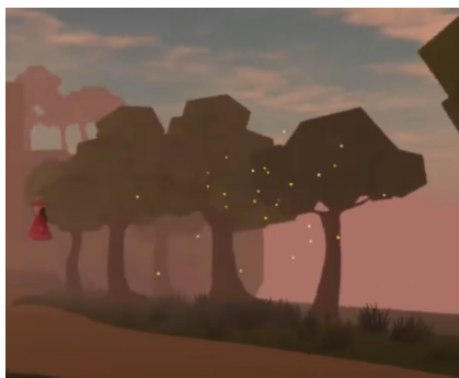
Figure 3.1.3 Kunang-kunang