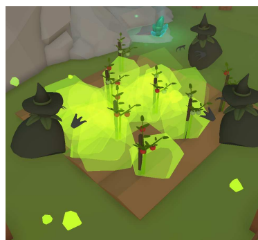
Figure 3.1.6 Asap beracun