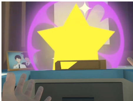
Figure 3.1.1 Ledakan peri saat pergi masuk kedalam map