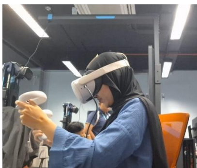
Figure 3.2.3. 1 “Wuuu... So satisfying ” (R4 Saat memasukkan apel kedalam box )

Penelitian menunjukkan bahwa penambahan efek visual berpartikel dan efek suara khas pada objek-objek interaktif secara signifikan meningkatkan makna simbolik dan keterlibatan pemain. Dalam tinjauan penelitian sebelumnya mereka menekankan bahwa rangsangan audiovisual yang disinkronkan dengan aksi pengguna bersifat relevan secara personal dan kontekstual [22]. Selanjutnya, penambahan umpan balik visiotaktil, misalnya simulasi sentuhan partikel yang “masuk” ke tangan pemain, meningkatkan ilusi perwujudan tubuh ( embodiment ) dan kepuasan yang lebih tinggi dibandingkan kondisi hanya visual saja [23]. Dengan demikian, implementasi efek partikel bercahaya, serpihan yang bergerak, dan suara khas saat objek dihancurkan atau digunakan tidak hanya memperindah tampilan, tetapi secara substansial memperkuat nilai simbolik, ekspektasi, dan pengalaman imersif pemain terhadap objek dalam “Game VR Mahakarya.”