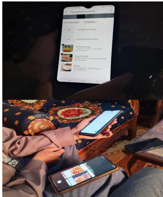
Gambar 3. Gambar Pendampingan Pembuatan Katalog Produk

Dari perspektif discoverability, kelengkapan atribut profil kategori, jam operasional, foto, dan deskripsi, meningkatkan peluang tampil pada hasil pencarian lokal bertujuan kunjungan. Ulasan pelanggan berperan sebagai sinyal kepercayaan yang memengaruhi keputusan akhir. Integrasi WhatsApp Business memperkuat dimensi layanan karena pelanggan dapat bertanya harga, ketersediaan, hingga melakukan pemesanan tanpa berpindah aplikasi. Alur percakapan yang terdokumentasi mempersingkat jarak antara minat dan transaksi serta menyediakan bukti untuk evaluasi. Temuan ini sejalan dengan studi adopsi WhatsApp Business di usaha kecil yang melaporkan peningkatan kecepatan respons dan kepuasan pelanggan (Fadhli et al., 2024).