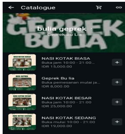
Gambar 4. Gambar Katalog Produk Whatsapp Business Geprek Bu Lia