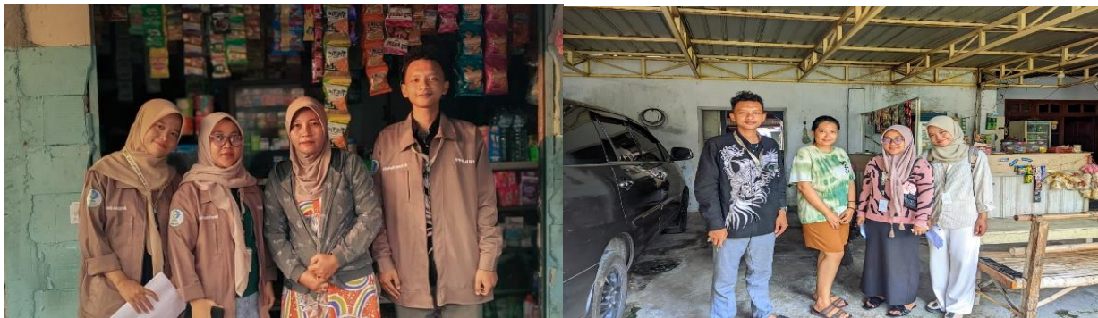
Gambar 1. Door to door untuk pendataan awal dan pendampingan

Katalog WhatsApp Business telah aktif pada mayoritas peserta dengan tiga hingga delapan item produk yang memuat nama, foto, harga, dan deskripsi ringkas. Fitur salam otomatis dan balasan cepat mengurangi waktu tanggap awal dan menjaga ekspektasi pelanggan. Pelabelan percakapan membantu memilah status seperti prospek, pesanan, dan selesai sehingga alur kerja harian lebih terstruktur. Praktik ini memperkuat profesionalisme komunikasi (WhatsApp LLC, 2024; Rahman & Taufik, 2022).