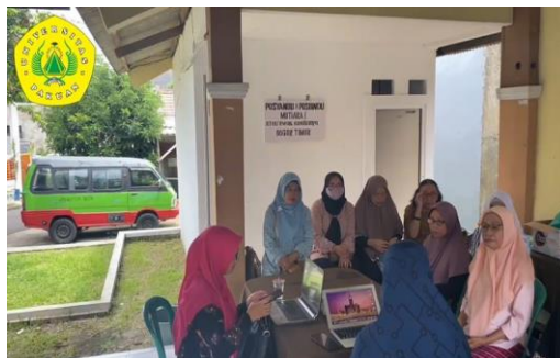
Gambar 3. Kader Posyandu menerima Pendampingan Aplikasi Reminder Imunisasi

Tahapan kedua ketua posyandu memberikan arahan kepada kader posyandu untuk melaksanakan pelatihan terkait aplikasi reminder imunisasi yang digunakan kader posyandu yang mana aplikasi tersebut berisi tentang data kader, data orang tua, data anak, data imunasi, reminder imunisasi, dan grafik pelaksanaan imunisasi. Kader posyandu dapat mendata setiap bulan terkait imunisasi yang akan diterima oleh masing-masing anak di setiap bulan dan dapat melakukan reminder imunisasi yang terhubung ke aplikasi mobile yang dimiliki orang tua, orang tua akan menerima notifikasi imunisasi sesuai dengan jadwal imunisasi yang telah dijadwalkan oleh kader posyandu. Kegiatan pendampingan tersebut bisa dilihat pada gambar 3 dan gambar 4.