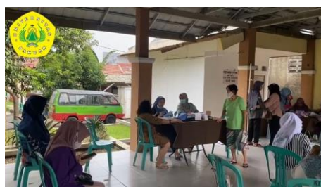
Gambar 4. Orang tua menerima Pendampingan Penggunaan Aplikasi Reminder Imunisasi