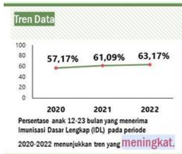
Gambar 1. Persentase Anak Umur 12-23 Bulan yang Menerima Imunisasi Dasar Lengkap Tahun 2020-2022

Tahun 2022, 63,17% anak umur 12-23 bulan telah melaksanakan IDL meski dimasa pandemic hal tersebut mengalami peningkatan. Berdasarkan survey dari Kementerian Kesehatan & UNICEF (2020) yang dilaksanakan diseluruh Indonesia pandangan orang tua dan pengasuh anak terkait permintaan imunisasi masih tinggi, banyak orang tua yang mengikut sertakan anaknya imunisasi di puskesmas bahkan mencari pelayanan Kesehatan alternatif yang dirasa lebih aman dimasa pandemic tersebut. Penelitian tersebut juga menunjukkan jika selama pandemi posyandu, klinik dan rumah sakit swasta menjadi sumber utama untuk mendapatkan layanan imunisasi anak [3].