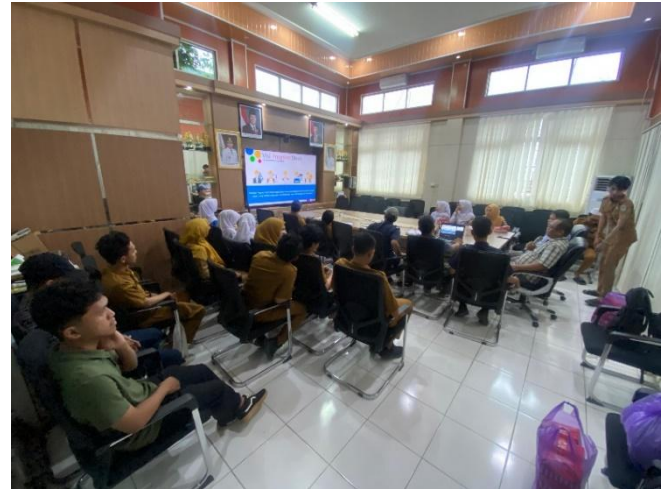
Gambar 3. Kegiatan Pengabdian Kepada Masyarakat

Dengan demikian, tujuan umum untuk meningkatkan kapasitas SDM Dinas PU Kabupaten Tanah Bumbu dalam mengelola proyek infrastruktur telah tercapai pada tahap awal. Keberlanjutan ( sustainability ) dari peningkatan kapasitas ini sangat bergantung pada komitmen pimpinan untuk memfasilitasi penerapan secara konsisten dan mendorong budaya kerja baru yang berbasis teknologi