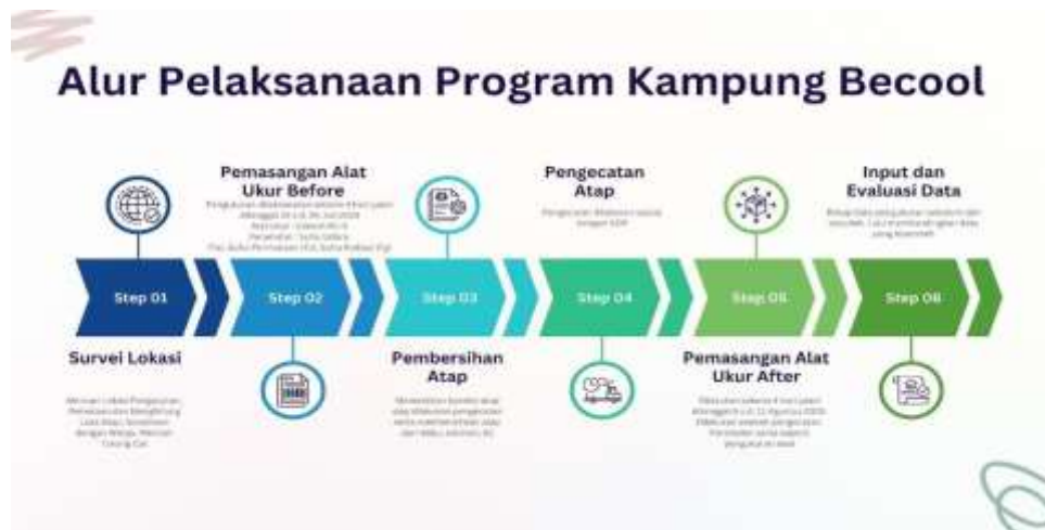
Gambar 2. Alur Pelaksanaan Program Kampung Becool

Pengukuran dilakukan dengan sensor Elitech RC-4 Data Logger di berbagai titik strategis (atas atap, plafon, dan lokasi sensor globe temperature) untuk mengetahui kondisi suhu dan radiasi yang mempengaruhi bangunan. Data diambil selama empat hari dengan interval pengambilan data setiap lima belas menit dimulai dari pukul 07.00 pagi hingga 18.00 sore setiap harinya, data sebelum pengecatan, dilanjutkan