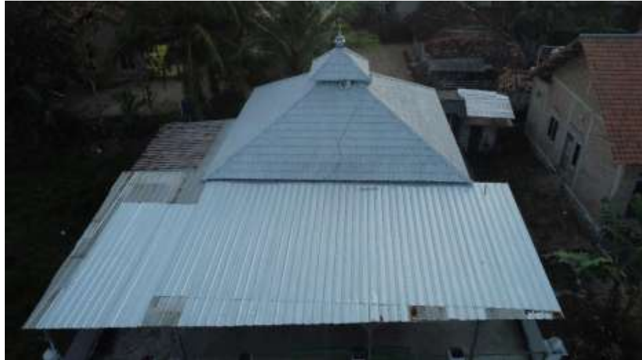
Gambar 1. Bangunan Tempat Penelitian

Penelitian ini menggunakan metode eksperimen dengan membandingkan data temperatur dan radiasi sebelum serta sesudah aplikasi cat reflektif surya pada atap bangunan. Objek penelitian adalah Mushola Al Anshor, Desa Rejomulyo, Lampung Selatan.