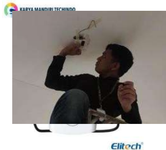
Gambar 3. Elitech RC-4