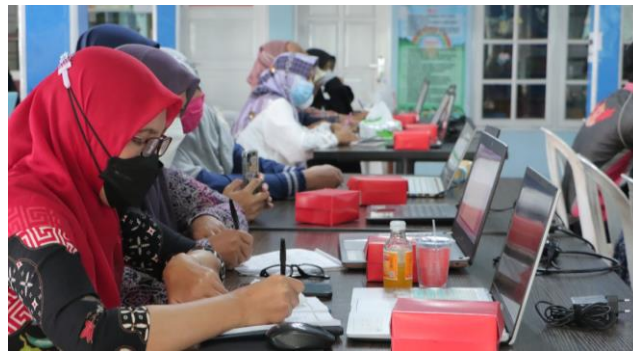
Gambar 2. Dokumentasi Kegiatan Pelatihan Canva

Daya tarik media sosial adalah konten dan untuk membuat konten yang bukan hanya foto produk, diperlukan desain dan packaging yang menarik. Membuat konten di Canva dapat dilakukan dengan memilih sosial, hasil pencarian memunculkan berbagai template yang ada dan dari pilihan template yang digunakan, desain konten bisa diganti dengan foto dan narasi sesuai dengan keinginan. Pelaksanaan sosialisasi dan pelatihan diantaranya bagaimana peserta dapat membuat konten di media sosial dengan mudah tetapi hasilnya menarik yang disampaikan narasumber. Agar proses sosialisasi dapat berjalan dengan baik, diskusi dengan peserta menjadi sarana untuk mengetahui sejauh mana pemahaman terhadap kegiatan yang dilakukan seperti Gambar 2.