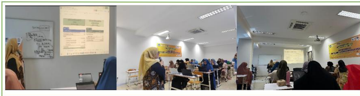
Gambar 2. Pelaksanaan Kegiatan Pelatihan Penyusunan Laporan Keuangan dengan Spreadsheet

Sebelum dan sesudah pelaksanaan kegiatan pelatihan penyusunan laporan keuangan UMKM dengan google spreadsheet , peserta mengikuti pretest dan posttest yang berisi pertanyaan seputar pemahaman dasar akuntansi, siklus akuntansi, klasifikasi akun, prinsip debit dan kredit, serta langkah-langkah teknis dalam menyusun laporan keuangan menggunakan spreadsheet . Evaluasi ini bertujuan untuk mengukur tingkat pemahaman peserta terhadap materi yang diberikan serta menilai efektivitas pelatihan dalam meningkatkan kemampuan pencatatan dan pelaporan keuangan secara digital. Hasil perbandingan nilai pretest dan posttest disajikan pada Tabel 1 berikut: