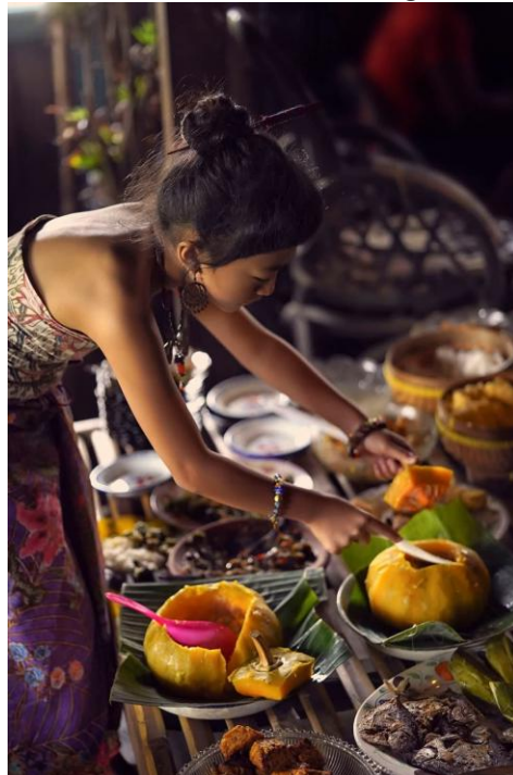
Gambar 3.2 Pembuatan Kolog Goblok