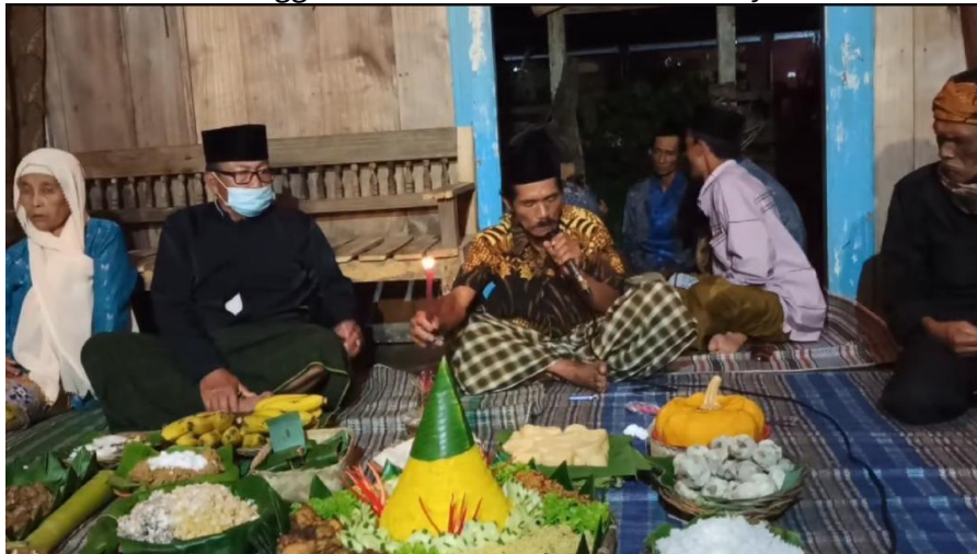
Gambar 3.1 Penggunaan Kolok Goblok dalam Tasyakuran Desa

Kolok Goblok adalah makanan tradisional khas dari Desa Wisata Poncokusumo, Kabupaten Malang. Desa Poncokusumo, yang terletak di Kabupaten Malang, merupakan tempat asal Kolok Goblok yakni sebuah olahan tradisional dari buah labu yang dikukus bersama isian kelapa parut dan gula merah. Desa ini dikenal sebagai salah satu desa wisata dengan berbagai atraksi budaya dan kuliner khas. Berkunjung ke Desa Poncokusumo tidak akan terasa lengkap tanpa mencicipi hidangan istimewa ini. Hal yang membedakan Kolok Goblok dari kolak pada umumnya adalah cara pembuatannya. Jika kolak biasanya dimasak dengan kuah santan dalam panci, Kolok Goblok justru dikukus di dalam buah labu itu sendiri.