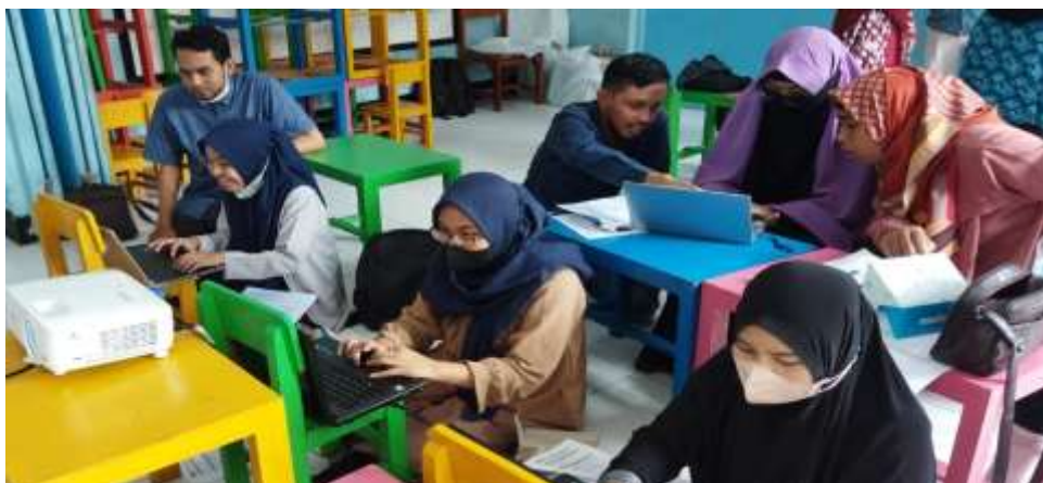
Gambar 2. Persiapan Pengabdian masyarakat

Gambar 2 adalah Persiapan acara pengabdian masyarakat. Pada persiapan peserta diminta untuk menginstall Office 2016. Sebelum pelatihan sudah diinformasikan, Panitia mencoba membantu apabila ada peserta yang belum menginstall Office 2016.