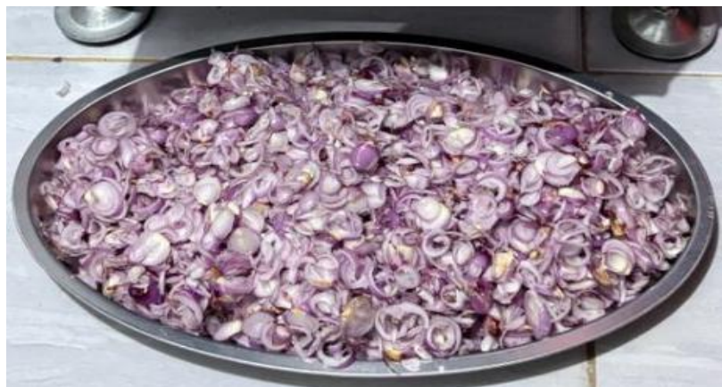
Gambar 2. Hasil irisan bawang.

Pengukuran keseragaman irisan dilakukan pada 50 sampel irisan yang diambil secara acak. Hasil pengukuran menunjukkan ketebalan irisan berkisar antara 2,0 mm hingga 3,2 mm dengan rata-rata 2,5 mm, standar deviasi 0,35 mm, dan koefisien variasi (CV) sebesar 14%. Berdasarkan klasifikasi Singh et al. (2022), mesin pengiris skala UMKM dengan CV di bawah 20% dikategorikan memiliki keseragaman yang baik, sementara CV di atas 25% dikategorikan tidak seragam. Dengan CV 14%, alat ini masuk kategori keseragaman baik. Sebagai perbandingan, mesin pengiris komersial skala industri umumnya mencapai CV 8–12% (Singh et al., 2022), sedangkan metode manual menghasilkan CV hingga 25–35% (Pratiwi et al., 2020). Keseragaman irisan yang relatif baik ini disebabkan oleh kestabilan putaran motor dan desain pisau yang presisi. Irisan yang seragam sangat penting dalam industri pengolahan makanan karena mempengaruhi kualitas produk akhir, terutama dalam proses pengeringan atau penggorengan.