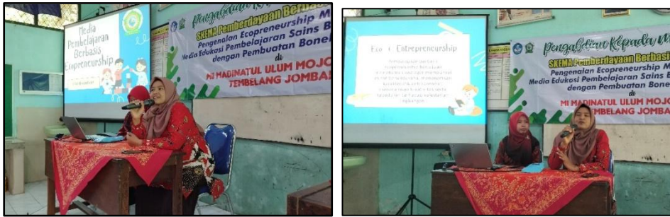
Gambar 3. Pemberian Materi tentang Media Pembelajaran Berbasis Ecopreneurship

Hari kedua dilanjutkan dengan pelatihan membuat media pembelajaran gantungan kunci berbentuk bangun datar dan lengkung. Media ini sebagai pengenalan bangun pada siswa sekolah dasar tingkat bawah. Media gantungan kunci dibuat dari limbah fashion yaitu kain dari baju bekas. Kegiatan pada hari pertama, dapat dilihat pada gambar 4.