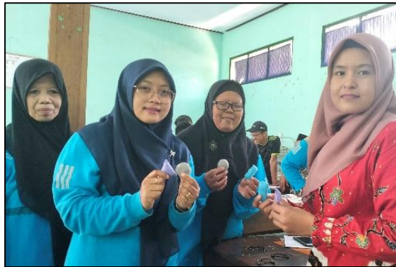
Gambar 4. Praktek Ecopreneurship Education melalui Media Pembelajaran Gantungan Kunci Berbentuk Dasar Bangun Datar Dan Bangun Ruang

Hari kedua dilanjutkan dengan pelatihan membuat media pembelajaran gantungan kunci berbentuk bangun datar dan lengkung. Media ini sebagai pengenalan bangun pada siswa sekolah dasar tingkat bawah. Media gantungan kunci dibuat dari limbah fashion yaitu kain dari baju bekas. Kegiatan pada hari pertama, dapat dilihat pada gambar 4.