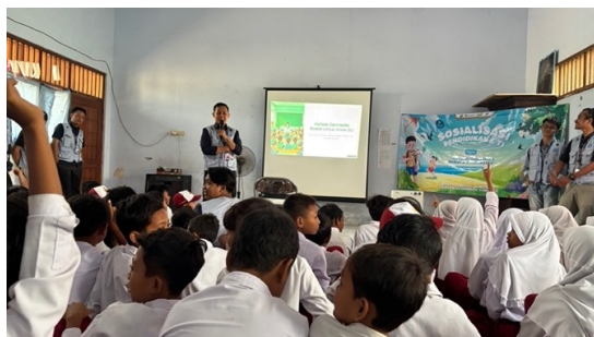
Gambar 2. Penyampain Materi oleh Tim Pengabdian

Selama kegiatan berlangsung, siswa menunjukkan antusiasme tinggi yang tampak dari banyaknya pertanyaan serta keaktifan dalam diskusi kelompok. Melalui role play , mereka dapat merasakan pengalaman sebagai pelaku maupun korban cyberbullying , sehingga lebih memahami dampak psikologis yang ditimbulkan. Pada sesi refleksi, mayoritas siswa mampu menuliskan kembali pemahaman mereka tentang etika bermedia sosial, yang menunjukkan adanya peningkatan kesadaran dan pemahaman terhadap pentingnya bersikap bijak dalam berinteraksi di ruang digital.