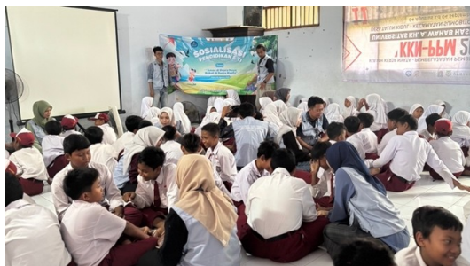
Gambar 1. Pelaksanaan Sosialisasi Cerdas dan Bijak dalam Bermedia Sosial.

tahapan. Pada proses pelaksanaan, tim pengabdian memberikan sosialisasi terhadap siswa dengan tema “Cerdas dan Bijak dalam Bermedia Sosial” yang diikuti oleh seluruh siswa kelas IV sampai VI SDN Talun Kidul. Sosialisasi memperoleh respon positif dari siswa maupun pihak sekolah. Penyampaian materi dilakukan secara interaktif dengan bantuan media visual, kemudian diperkuat melalui permainan edukatif dan simulasi peran ( role play ) mengenai praktik bullying di media sosial.