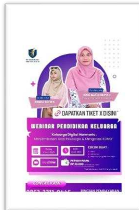
Gambar 2: sosialisasi webinar.

Webinar ini memberikan dampak positif jangka pendek, seperti peningkatan literasi digital dan keterampilan komunikasi keluarga. Beberapa peserta bahkan mengusulkan tindak lanjut berupa: (1) sesi pendampingan atau kelas lanjutan, (2) grup diskusi daring untuk berbagi praktik baik antar keluarga, (3) modul panduan untuk orang tua mendampingi anak di era digital.