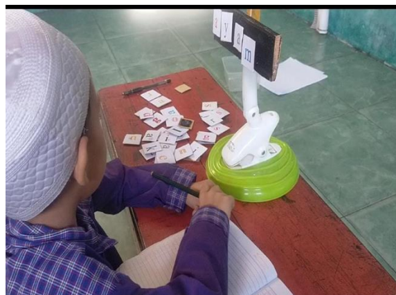
Gambar 4. Kegiatan pembelajaran siklus II

Menurut temuan dari analisis data pada tahap sebelum siklus dilaksanakan pada tanggal 25 September 2023, Pada tahap ini, peneliti mengobservasi kemampuan kognitif yang dimiliki anak, peneliti mengamati kemampuan kognitif anak mengenal pola dan lambang huruf serta menulis huruf yang telah dicontohkan pada kelompok Abu Bakar. Sedangkan pada siklus I dilaksanakan selama empat kali pertemuan mulai dari tanggal 3,16,25 Oktober sampai dengan 2 November 2023, siklus II dilaksanakan pada tanggal 6, 21, 30 November dan 2 Desember 2023. Hasil observasi kemampuan mengenal pola dan lambang huruf serta menulis huruf yang telah dicontohkan pra siklus, siklus I dan II pada tabel 1 menunjukkan hasil anak dengan instrumen lembar observasi dibawah ini: