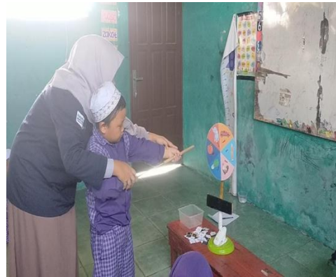
Gambar 3. Kegiatan pembelajaran siklus I