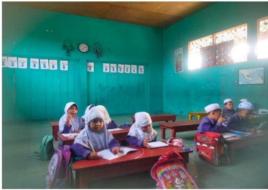
Gambar 2. Kegiatan pembelajaran sebelum dilaksanakan tindakan Sebelum Siklus