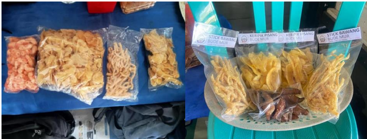
Gambar 7. Logo Kemasan Produk Keripik Pisang (a) dan Stick Bawang (b)