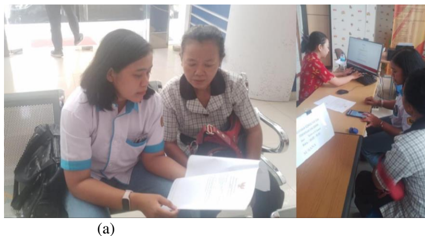
Gambar 9. Persiapan berkas untuk pembuatan nomor P-IRT (a) dan proses pembuatan nomor P-IRT (b)

Setelah kemasan produk siap, maka tim pengabdian mendampingi kelompok Bude untuk mengajukan nomor P-IRT pada Badan Perizinan Terpadu Satu Pintu di Jayapura. Proses dimulai dengan penyiapan berkas dan pembuatan akun OSS. Berkas kemudian dilimpahkan untuk mengajukan nomor P-IRT.