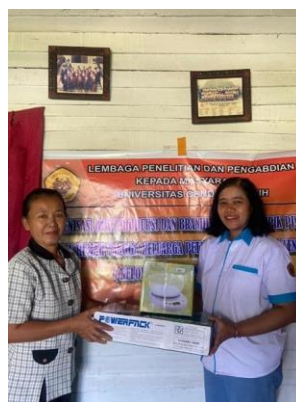
Gambar 4. Penyerahan peralatan produksi kepada kelompok usaha Bude

Kegiatan pengabdian dilaksanakan di kediaman Bude yang bertempat di Distrik Muara Tami, Koya Tengah. Kegiatan ini ditandai dengan penyerahan perlengkapan produksi baru seperti ditunjukkan pada Gambar 4. Jika dibandingkan dengan kondisi sebelum pengabdian, kelompok usaha masih menggunakan takaran kasar dengan tangan untuk menentukan volume produk dalam kemasan seperti yang ditunjukkan pada Gambar 5(a). Setelah kegiatan pengabdian dengan diberikannya timbangan digital, setiap kemasan dapat diisi dengan produk yang memiliki berat yang sama. Hal ini tentu dapat mencega kerugian bagi kelompok usaha akibat kemasan dengan isi yang berlebih ataupun konsumen dengan isi yang kurang.