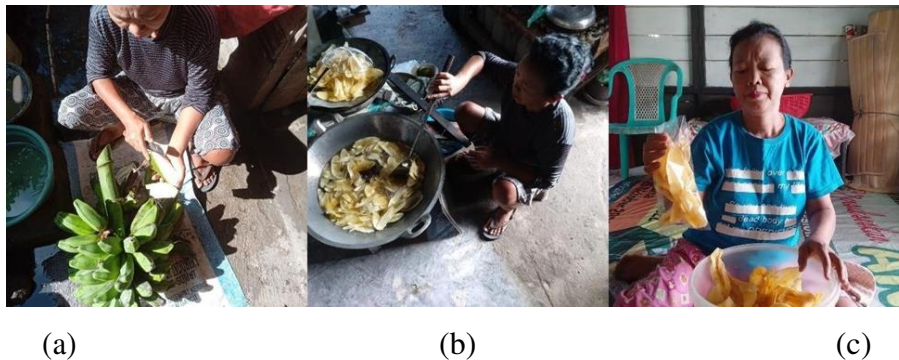
Gambar 1. Proses Produksi Keripik Pisang (a) Pengupasan (b) Penggorengan (c) Pengemasan

Salah satu kelompok petani pisang di koya tengah adalah kelompok Bude yang adalah mitra pengabdian ini. Kelompok ini terdiri dari empat kepala keluarga yang berkerabat dekat. Kelompok mitra memiliki kebun pisang seluas seperempat hektar yang berlokasi di belakang area rumah. Kebun ini menghasilkan rata-rata 15 tandan pisang setiap bulan, karena ditanam secara bergilir. Sebagian besar hasil panen akan langsung dipasarkan, sedangkan sisanya digunakan sebagai bahan keripik pisang dan konsumsi pribadi.