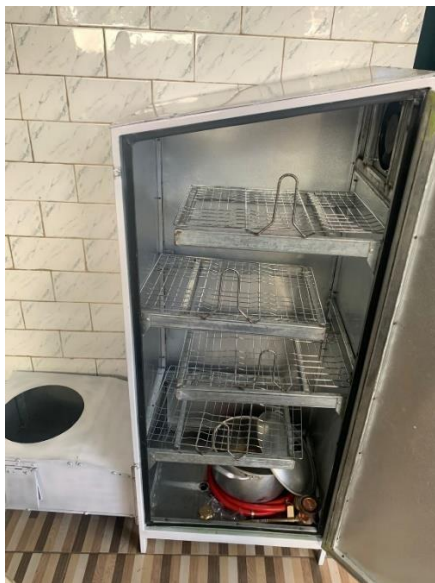
Gambar 3. Pembuatan Alat

Kemudian alat di buat dalam kurun waktu 7 hari