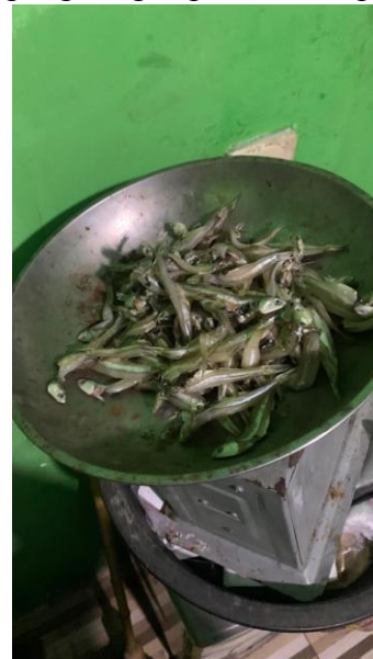
Gambar 5. Hasil Pengeringan

Ini adalah foto dari hasil proses pengeringan pada mesin pengering