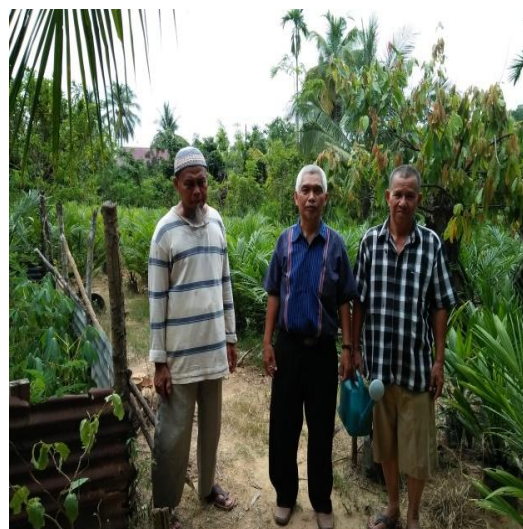
Gambar 7. Ketua Pelaksana bersama Peserta

Hasil evaluasi, 50% peserta telah mencobanya di lahan pertanian mereka. Dengan demikian kegiatan pelatihan ini memberikan kontribusi positif bagi peserta pelatihan. Sebagai indikatornya adalah tersedianya pupuk yang murah, penggarapan lahan efektif, efisien dan berhasil guna.