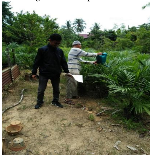
Gambar 6. Monitoring oleh Pemantau

Gambar dan Tabel 1 merupakan hasil monitoring dan evaluasi pelatihan.