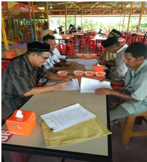
Gambar 9. Evaluasi Kegiatan Pos Test

Kegiatan pelatihan ini dikatakan efektif atau berhasil jika minimal 75% peserta pelatihan bersedia mempraktekkan membuat pupuk organik sendiri dan mengaplikasikan di lahan pertanian