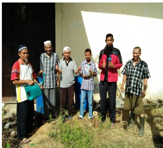
Gambar 3. Dokumen hasil pupuk kalium

Penggunaan pupuk kalium cair yang dihasilkan dari pelatihan ini dipergunakan pada tanaman hortikultura diantaranya diaplikasikan pada lahan pembibitan kelapa sawit sebagaimana gambar berikut.