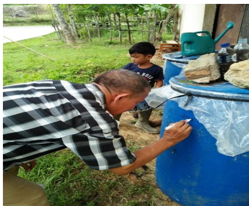
Gambar 2. Reaktor pupuk kalium cair

Pembuatan pupuk kalium cair dilaksanakan dengan dua metode, yaitu metode cacah dan metode tanpa cacah. Pada metode cacah penggunaan bahan baku sabut kelapa dicacah atau sabut yang ada dipotong-potong dengan ukuran sekitar 5 cm, selanjutnya bahan dapat digunakan sebagai bahan baku pupuk kalium cair. Pada metode tanpa cacah, sabut kelapa sebagai bahan baku, pada penggunaannya sabut kelapa yang ada dapat langsung digunakan dengan cara memasukkan ke dalam reaktor disusun bertumpuk. Implementasi kegiatan pembuatan pupuk untuk masing-masing metode dapat diperlihatkan pada gambar 2 berikut, sedangkan gambar 3 adalah dokumen hasil produksi pupuk kalium cair untuk masing-masing metode dan alat untuk penggunaannya.