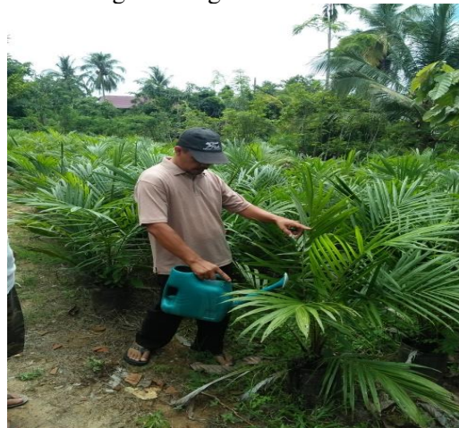
Gambar 4. Penggunaan Pupuk Kalium Cair

Penggunaan pupuk kalium cair yang dihasilkan dari pelatihan ini dipergunakan pada tanaman hortikultura diantaranya diaplikasikan pada lahan pembibitan kelapa sawit sebagaimana gambar berikut.