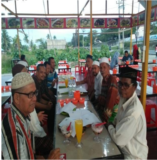
Gambar 8. Evaluasi Kegiatan Pre Test

Dari Tabel 1 diketahui semua peserta mengatakan bahwa kegiatan pelatihan ini bermanfaat bagi mereka. Kegiatan pelatihan ini dapat meningkatkan pengetahuan peserta untuk memanfaatkan potensi sumberdaya hayati yang tersedia, untuk diolah menjadi pupuk organik yang ramah lingkungan dan jauh lebih murah dari pupuk kimia.