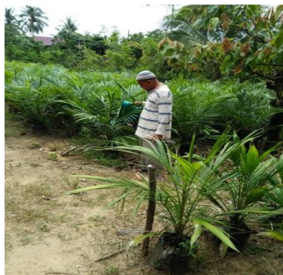
Gambar 5. Penggunaan Pupuk Kalium Cair