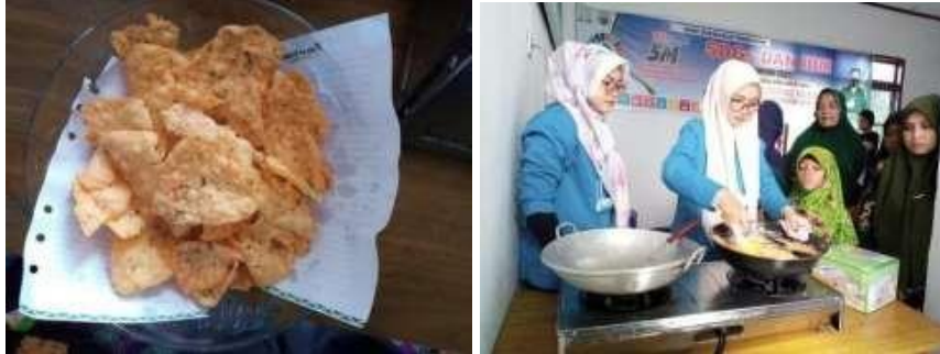
Gambar 6. Proses Pembuatan Kerupuk Ikan Asin

Ikan asin yang berasal dari ikan kancing – kancing ini pertama kali di terapkan di Desa Keutapang Mameh dikarenakan potensi hasil ikan laut yang dihasilkan yaitu ikan kancing – kancing. Untuk itu, sangat disarankan agar produk ikan kancing – kancing dapat diterapkan oleh masyarakat yang berada di Aceh Timur.