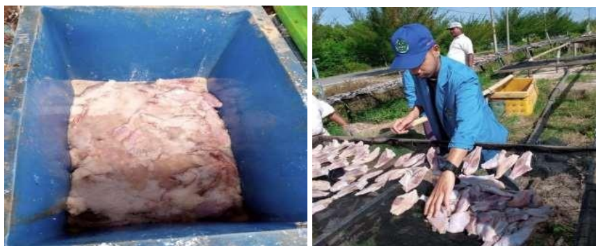
Gambar 5. Proses Pengawetan Ikan Asin

Kegiatan proses pengawetan ikan asin kepada petani tambak Desa Keutapang Mameh dilaksanakan pada hari kelima KKN Tematik. Kami mengunjungi para petani tambak dan juga melihat langsung proses pembuatan ikan asin, dimana ikan asin yang dihasilkan oleh Desa Keutapang Mameh yaitu ikan kambing – kambing dan ikan calang yang menjadikan ciri khas dari Desa tersebut. Kami memberikan pemahaman mengenai proses pengawetan ikan asin secara kimiawi dengan garam. Pembuatan ikan asin mengacu terhadap metode tradisional pembuatan ikan asin yang dilakukan oleh masyarakat Aceh.