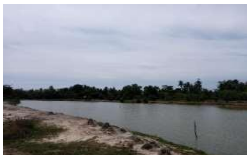
Gambar 2. Lokasi Tambak Desa Keutapang Mameh

Budidaya perairan merupakan salah satu teknologi yang telah dikembangkan dan dapat menjadi salah satu strategi dalam memenuhi kebutuhan pangan. Manfaat plankton pada pengelolaan tambak udang dan ikan intensif yaitu saat kekeruhan karena plankton dengan nilai daya cerah perairan antara 30-40 cm justru diperlukan dan pertumbuhan plankton yang baik ditandai oleh berubahnya warna air tambak dari coklat hingga hijau muda mutlah dipertahankan karena satu budidaya plankton dikenal dengan EM4. EM4 (Effective Microorganisms) berupa cairan berwarna kecoklatan dan berbau manis asam (segar). Kegiatan sosialisasi kepada masyarakat Desa Keutapang Mameh tentang Budidaya Plankton di Tambak dilaksanakan pada hari kelima KKN Tematik.