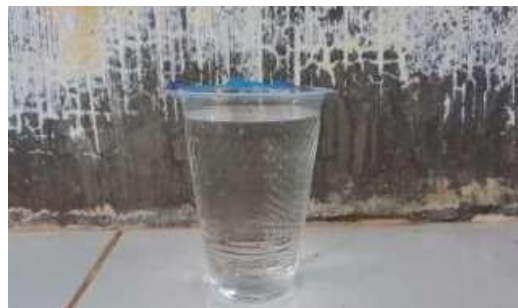
Gambar 10. Hasil Penyaringan Air