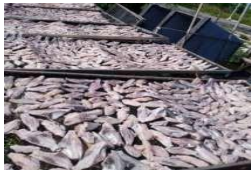
Gambar 1. Ikan asin kambing – kambing

Kerupuk adalah makanan ringan yang dibuat dari adonan tepung tapioka yang dicampurkan bahan perasa seperti udang dan ikan. Kerupuk juga jenis makanan kering yang sangat populer di Indonesia, mengandung pati cukup tinggi, serta dibuat dari bahan dasar tepung tapioka dan bisa menjadikan lauk sederhana untuk makanan, karena rasanya yang gurih dan enak yang dapat menambah selera makan. Kerupuk Ikan Asin menggunakan Ikan Asin Kambing-kambing yang tidak layak jual karena patah.