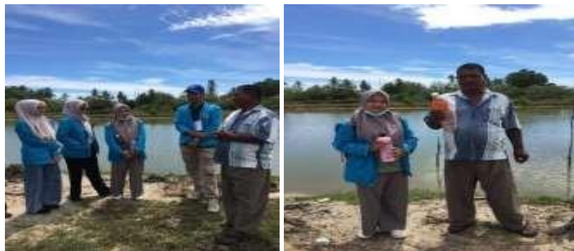
Gambar 4. Sosialisasi Cara Menumbuhkan Plankton kepada Petani Tambak

Masyarakat terutama para petani tambak sangat antusias dalam menanggapi sosialisasi tersebut dan hal ini dapat diketahui dengan beberapa pertanyaan dan keingintahuan masyarakat mengenai proses budidaya plankton di tambak dengan sistem yang ramah lingkungan, dengan bahan alami, murah dan juga sangat ekonomis. Masyarakat juga dapat mengaplikasikan hasil fermentasi plankton kepada tambak mereka dan juga mereka dapat memperkenalkan fermentasi plankton ini kepada para petani tambak lainnya.