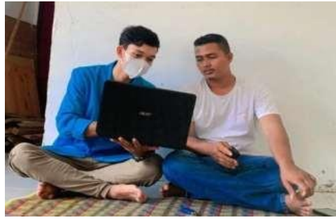
Gambar 11. Penyerahan Website Kepada Bapak Geuchik Desa Keutapang Mameh

Kerupuk Ikan Asin Merupakan Sebuah Produk Makanan Inovasi terbaru dari Desa Keutapang Mameh yang dimana berbahan Tepung Tapioka, Tepung Terigu dan Ikan Asin. Ikan Asin yang terkenal di Desa Keutapang Mameh itu sendiri banyak diminati oleh masyarakat setempat. Namun, karena terlalu sering Ikan Asin hanya dijadikan Lauk Pauk. Kami Mahasiswa KKN Tematik 2021 menyarankan Ide untuk pengolahan Ikan Asin menjadi Menarik dan Agar semakin banyak digemari oleh Masyarakat dan tak hanya masyarakat Setempat melainkan masyarakat luas yg berada di luar Desa Keutapang Mameh kecamatan Idi Rayeuk Kabupaten Aceh Timur. Oleh sebab itu kami mahasiswa KKN Tematik membuat web resmi Desa Keutapang Mameh untuk pemasaran kerupuk ikan asin agar kegiatan ini bisa berjalan dengan maksimal.