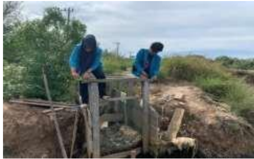
Gambar 3. Pengukuran Pintu Air Tambak

Teknik pelaksanaan dari program kerja ini seperti melakukan survey pada lokasi yang akan ditinjau, melakukan survey terhadap masyarakat sekitar untuk mencari informasi tentang program kerja yang akan dilakukan, dan melakukan perencanaan terhadap saluran irigasi tambak tersebut. Dalam pelaksanaan program kerja ini tidak ada bantuan dana dari desa sehingga program kerja ini hanya sebatas perencanaan dan tidak sampai ke tahap fisik (pembuatan).