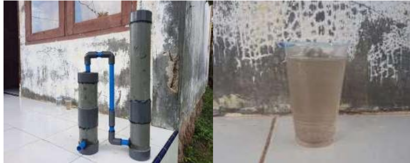
Gambar 8. Sampel Alat Filtrasi Air Baku

penggunaan air nya ialah air payau dengan kadar air (pH) < 7 yang membuat air tersebut sangat tidak nyaman digunakan oleh penderitanya. Oleh karena itu pada kegiatan KKN Tematik ini kami mahasiswa prodi Teknik Sipil berusaha untuk membuat alat filtrasi air untuk mendapatkan kadar air (pH) = 7 untuk membuat air tersebut tidak terasa asam dan memiliki warna air yang bening.