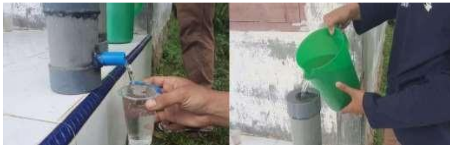
Gambar 9. Proses Penyaringan Air