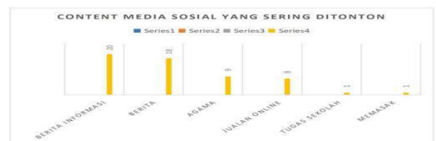
Gambar 4. Konten Media Sosial Yang Sering Ditonton Sumber: Olahan Peneliti

Konten media sosial yang sering ditonton masyarakat Bligo, yaitu Berita informasi ada 20 informan, Berita 18 informan, Agama 9, Jualan online 8, bahan tugas sekolah 1 dan lain lain memasak 1 informan, dapat dilihat pada diagram 4.