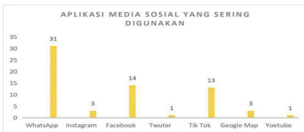
Gambar 5. Aplikasi Media Sosial Yang Sering Digunakan

Aplikasi media sosial yang sering digunakan masyarakat Bligo yakni: WhatsApp 31 informan, Instagram 3 informan, Facebook 14 informan, twitter 1 informan, Tik Tok 13 informan, google map 3 informan, dan Telegram serta youtube masing-masing 1 responden, dapat dilihat pada diagram 5.