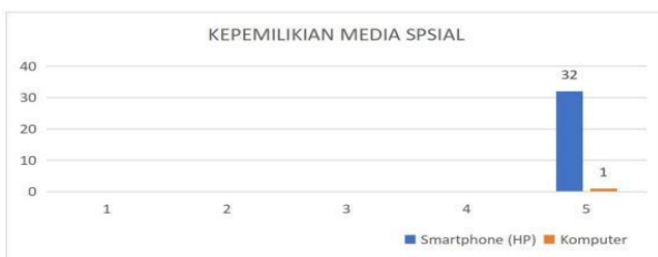
Gambar 1. Diagram Kepemilikan Media Sosial

Semua informan secara keseluruhan memiliki smartphone yakni 32 informan menyatakan menggunakan Handphone (HP) dalam menggunakan media sosial, sedang yang menggunakan Laptop maupun personal komputer 1 responden, dapat dilihat pada diagram.