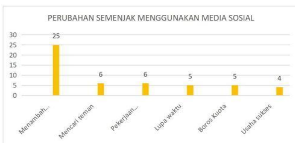
Gambar 6. Perubahan Semenjak Menggunakan Media Sosial

Pola perubahan selama menggunakan media sosial semenjak menggunakan media sosial masyarakat Bligo, yakni menambah pengetahuan dan 25 informan, dalam rangka mencari teman ada 6 informan, pekerjaan menjadi terbengkalai ada 6 informan, luca waktu ada 5 informan, boros kuota ada 5 informan, dan usahanya sukses ada 4 informan. Dapat dilihat pada diagram 6.