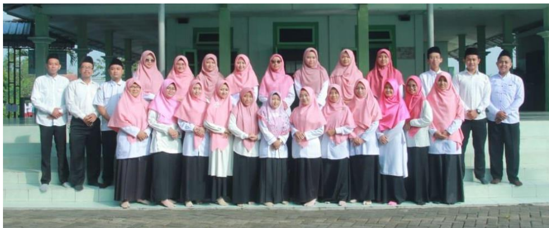
Gambar 4. Foto Bersama Setelah Sosialisasi Website SD IT Al-Hikam

Setelah proses sosialisasi, dilakukan pengambilan penilaian terhadap website yang telah dibangun. Penilaian dilakukan dengan menyebarkan kuesioner kepada Guru dan Karyawan di SD IT Al-Hikam, pengelola website , orang tua/ wali siswa, serta masyarakat. Total responden yang mengisi kuesioner sebanyak 39 responden. Terdiri dari guru dan karyawan sebanyak 26 responden, orang tua/wali sebanyak 9 responden dan masyarakat umum sebanyak 4 responden.