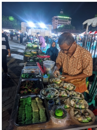
Gambar 2. UMKM Getuk Sugeng di Event

Pelaku UMKM merasa sangat terbantu dengan dilaksanakannya serangkaian event oleh Dinas Pariwisata dan antusias untuk ikutserta apabila dikemudian hari dilaksanakan event kembali oleh Dinas Pariwisata.