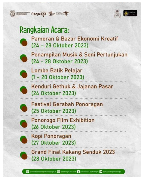
Gambar 1. Pamflet Rangkaian Acara Ekonomi Kreatif

Pelaku UMKM menyampaikan bahwa tidak ada ajakan dalam merumuskan sebuah event, mereka justru yang mendaftarkan diri kepada Dinas Pariwisata untuk dapat berpartisipasi membuka lapak didalam event sesuai prosedur yang sudah ditetapkan oleh Dinas Pariwisata Ponorogo, selain melalui jalur pendaftaran salah satu UMKM juga menyebutkan bahwa mereka mendapatkan undangan dari Dinas Pariwisata untuk ikut serta dalam event.