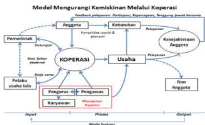
Gambar 02: Model mengurangi kemiskinan melalui koperasi

Model penerapan menggabungkan kekuatan internal koperasi dan eksternal memberikan kontribusi positif untuk memperkuat posisi koperasi sebagai pelaku usaha yang mampu mewujudkan kesejahteraan bersama. Faktor fundamental dari semua itu adalah koperasi harus menerapkan prinsip dan nilai koperasi sebagai jatidirinya yang membedakan koperasi dengan palaku usaha lain. Keberhasilan koperasi membangun kesejahteraan anggota juga harus diletakan pada partisipasi anggota dalam organisasi maupun bisnis. Jika digambarkan model mengurangi kemiskinan melalui koperasi diatas adalah sebagai berikut.