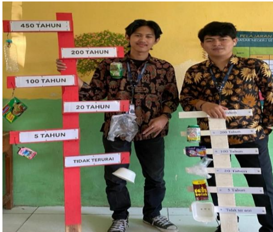
Gambar. 6 Mading Sampah/ Edukasi Visual jenis sampah

setelah sosialisasi dengan Bank Sampah My Gold , tim membuat media edukasi visual seperti mading mengenai sampah. Di mana dalam media edukasi visual sebagai properti mengenai “berapa lama jenis-jenis sampah terurai” yang dipasang di lingkungan sekolah.