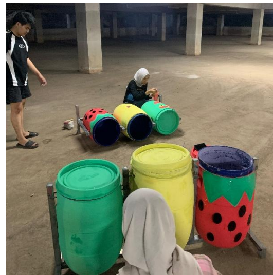
Gambar.7 Pembuatan Tong Sampah

rumah dan lingkungan di mana siswa-siswi berada. (Yuliza, et al., 2023)