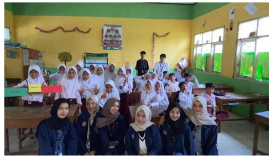
Gambar.2 Simulasi literasi sampah

Pelaksanaan pre-test untuk mengukur pemahaman siswa tentang pengelolaan sampah, sumber sampah dan jenis-jenis sampah dengan melakukan praktik langsung pemilahan dan pewadahan sampah untuk kelas 5. Siswa kelas 5 SD dengan jumlah 22 siswa. Sebelum pemaparan materi dilakukan games pemilahan sampah dengan que card, dimana anak-anak akan melakukan pemilahan sampah sesuai kategori (Organik, Anorganik, dan B3).