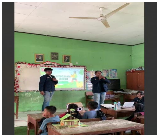
Gambar.1 Sosialisasi kegiatan pengabdian

Pelaksanaan sosialisasi dibuka dengan melakukan pengenalan tim pengabdian dan penjelasan singkat mengenai maksud dan tujuan kegiatan pengabdian ini, hal ini dimaksudkan agar siswa-siswi dan tim terjalin komunikasi yang baik, dengan memberikan gambaran singkat mengenai topik edukasi sampah dengan materinya apa saja guna menarik minat siswa-siswa mengikuti kegiatan pengabdian literasi pengelolaan sampah bagi siswa-siswi SDN 19 Kota Serang.