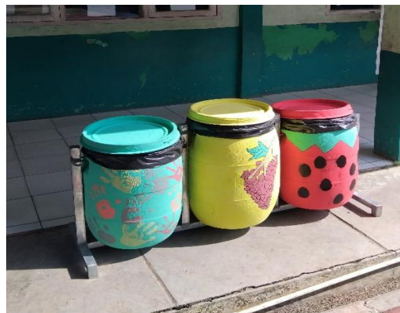
Gambar. 8 Tong Sampah di Sekolah

Terakhir tim kami melakukan diskusi dengan siswa-siswa dan guru-guru sekolah SDN 19 Kota Serang yang dihadiri Kepala Sekolah. Kegiatan Pengabdian literasi pengelolaan sampah bagi Siswa-siswi SDN 19 Kota Serang memberikan pentingnya menjaga lingkungan dan cara pengelolaan sampah. Sampah organik dan anorganik tidak boleh tercampur menjadi satu, karena dapat membuat sampah menjadi busuk bahkan berpotensi meledak. (Puspitasari , et al., 2024)