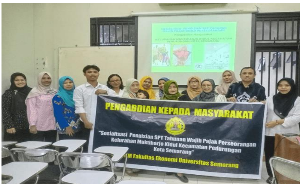
Gambar.4 Sesi Foto Bersama Mitra UMKM dalam Kegiatan Pengabdian kepada Masyarakat

Gambar 3 memperlihatkan suasana saat sesi diskusi dan tanya jawab berlangsung dalam kegiatan Pengabdian kepada Masyarakat (PKM) pada 24 Desember 2024 di Fakultas Ekonomi Universitas Semarang. Peserta yang merupakan pelaku UMKM Kelurahan Muktiharjo Kidul tampak antusias mengikuti materi yang disampaikan narasumber. Materi yang ditampilkan melalui proyektor berisi dasar-dasar perpajakan UMKM, dengan sesi diskusi difokuskan pada permasalahan nyata yang sering dihadapi peserta dalam proses pelaporan pajak.