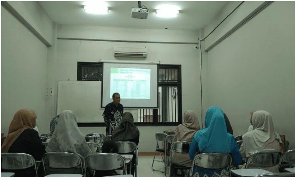
Gambar.3 Sesi Diskusi Interaktif dan Tanya Jawab pada Pelatihan Perpajakan UMKM

keberlanjutan usaha mereka sekaligus memberikan kontribusi positif terhadap pembangunan daerah.