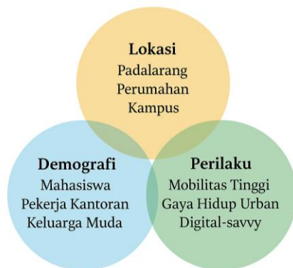
Gambar 1. Diagram Segmentasi Pasar