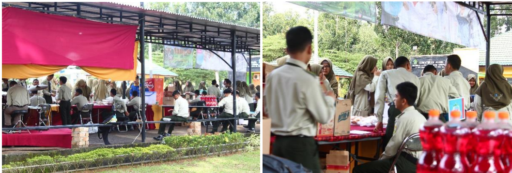
Gambar 2 dan 3. Pemasaran hasil kewirausahaan di MAN Insan Cendekia Jambi

Adapun alur proses keterampilan kewirausahaan di MAN Insan Cendekia Jambi dijelaskan oleh partisipan NM: