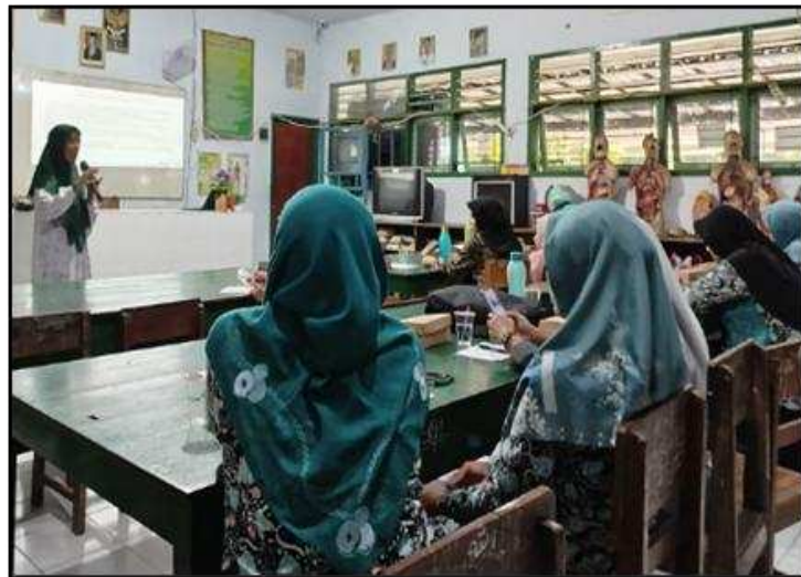
Gambar 3. Penyajian Materi oleh Narasumber Kedua

Mengupas ide-ide kreatif dan inovatif yang mampu memberikan peluang besar menjadi juara di ajang kompetisi MYRES. (4) Memberikan contoh ide judul untuk MYRES yang kreatif dan inovatif. Berikut adalah bukti penyajian materi oleh narasumber kedua ketika pelaksanaan pelatihan ini berlangsung.