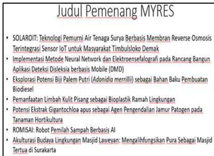
Gambar 4. Cuplikan PPT Materi yang Disampaikan Oleh Narasumber Kedua