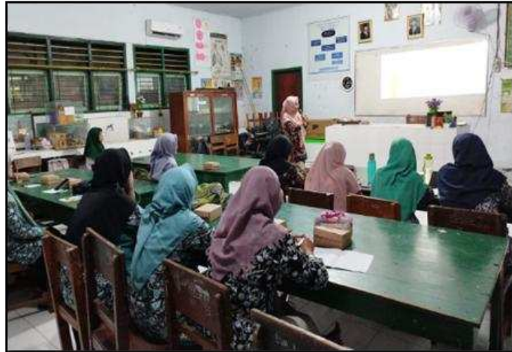
Gambar 1. Penyajian Materi oleh Narasumber Pertama

tentang Sistematika Penyusunan MYRES. (4) Menjelaskan tentang karakteristik judul yang berpeluang besar diterima di ajang kompetisi MYRES. Berikut adalah bukti penyajian materi oleh narasumber pertama ketika pelaksanaan pelatihan ini berlangsung.