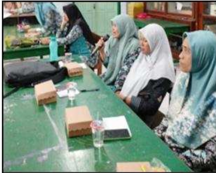
Gambar 5. Antusias Peserta Pelatihan Pada Sesi Tanya Jawab

memperhatikan dengan baik. Selain itu, ketika sesi tanya jawab berlangsung, sekitar 90% guru bertanya kepada tim pengabdian. Berikut adalah bukti antusiasnya peserta pelatihan pada sesi tanya jawab.