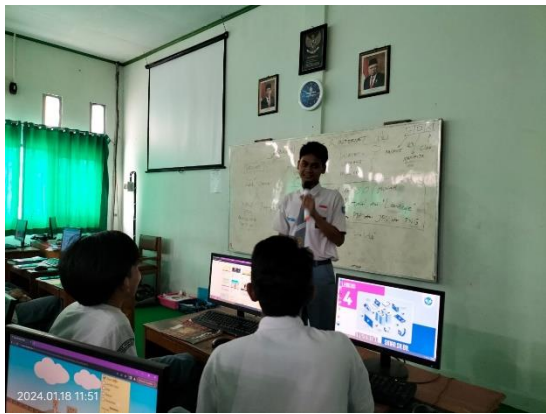
Gambar 2. Siswa menyampaikan argumentasinya di depan kelas

Penggunaan simulasi PhET membantu siswa untuk berpikir lebih kritis dan logis karena mereka dihadapkan pada situasi nyata yang harus mereka analisis dan pecahkan. Ini berimplikasi bahwa simulasi semacam ini dapat dijadikan bagian integral dari pembelajaran fisika untuk mendorong siswa lebih aktif dalam berpikir dan berdiskusi.