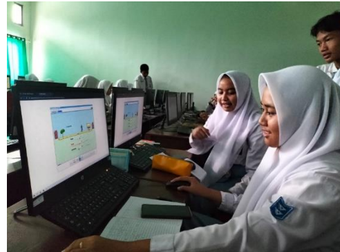
Gambar 6. Siswa sedang melakukan diskusi dan saling membantu

Simulasi PhET memberikan ruang bagi siswa untuk bekerja sama dan berdiskusi, baik dalam kelompok kecil maupun besar, yang berkontribusi pada pengembangan keterampilan komunikasi dan argumentasi. Implikasinya adalah bahwa pembelajaran berbasis simulasi sebaiknya diintegrasikan dengan metode diskusi kelompok untuk memaksimalkan hasil belajar.