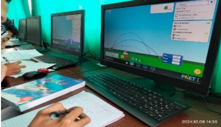
Gambar 4. Visualisasi PhET

bahwa penggunaan alat bantu visual seperti PhET sebaiknya diterapkan secara luas pada berbagai topik fisika, terutama yang memerlukan visualisasi konsep.