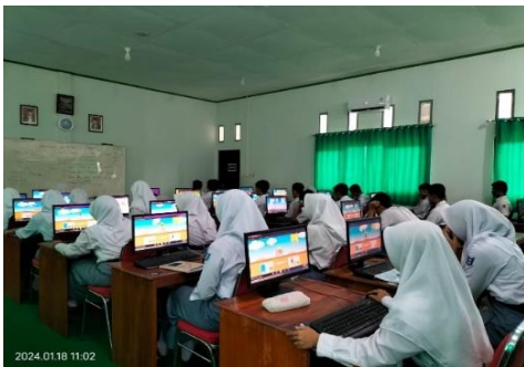
Gambar 5. Refleksi Siswa

Hasil observasi menunjukkan bahwa simulasi PhET secara signifikan meningkatkan keterlibatan siswa. Interaktivitas dari simulasi tersebut menarik perhatian siswa lebih baik daripada metode pengajaran konvensional, dan siswa lebih berpartisipasi dalam diskusi kelas serta lebih mendalam dalam mengeksplorasi konsep-konsep ilmiah.