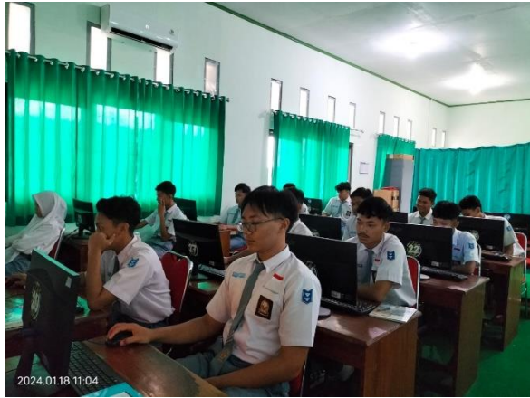
Gambar 1. Siswa sedang melakukan simulasi PhET