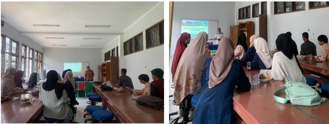
Gambar 4. Proses Pelaksanaan Penyuluhan kepada Mahasiswa

Tahap terakhir dari metodologi pengabdian ini, yaitu evaluasi. Tahapan ini berfungsi untuk mengukur efektivitas program dan memastikan keberlanjutan serta replikasi dampak. Evaluasi dilakukan dengan pendekatan kuantitatif dan kualitatif, dirancang untuk membandingkan kondisi pengelolaan sampah sebelum dan sesudah intervensi.