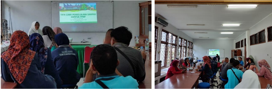
Gambar 3. Proses Pelaksanaan Penyuluhan kepada Petugas Kebersihan