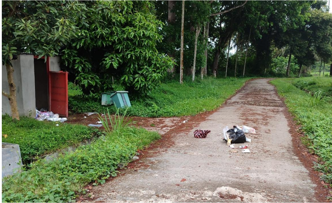
Gambar 2. Observasi permasalahan sampah di Gedung Asrama Mahasiswa PPNP

Data ini menjadi landasan untuk perancangan materi penyuluhan. Temuan ini mengarahkan tim untuk memfokuskan materi pelatihan pada aspek pemilahan di sumber, teknik pengolahan sampah organik sederhana, dan potensi ekonomi dari sampah anorganik. Materi penyuluhan akan mencakup lima komponen utama yang esensial dalam pengelolaan sampah terpadu: