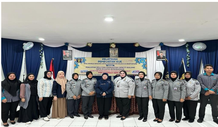
Foto 2. Tim Abdimas bersama LPP Klas 2A Martapura

Oleh karena itu, selama dalam pembinaan LPP Klas IIA Martapura, warga binaan harus bisa diberikan peningkatan kapasitas dirinya agar ketika kelak kembali pada keluarga dan masyarakat, tidak menjadi beban sosial dan ekonomi yang berkepanjangan. Untuk itu harus ada upaya-upaya dalam meningkatkan kapasitas ( Capacity building ) warga binaan yang dilakukan oleh pihak manajemen LPP Klas IIA Martapura.