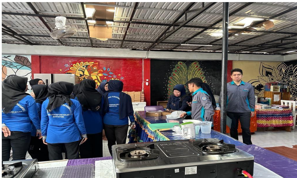
Foto 3. Praktek pelatihan pembuatan kue bagi warga binaan

LPP Klas IIA Martapura ini memiliki warga binaan atau “penghuni” lebih dari 500 orang dengan status masa tahanan diatas 2 (dua) tahun, setelah selesai perkaranya dan telah mendekam di LP Klas I di Kabupaten/Kota se Kalimantan Selatan, baru bisa dipindahkan ke LPP Klas IIA Martapura ini. Selama menjalani dan menghabiskan hari-harinya di LPP ini, narapidana atau warga binaan diberikan berbagai pelatihan dan bekal ketrampilan hidup ( life skills ) agar kelak ketika sudah kembali bebas menjadi warga masyarakat kembali, mereka akan bisa menjalani hidup dengan modal ketrampilan yang sudah diberikan selama di LPP ini.