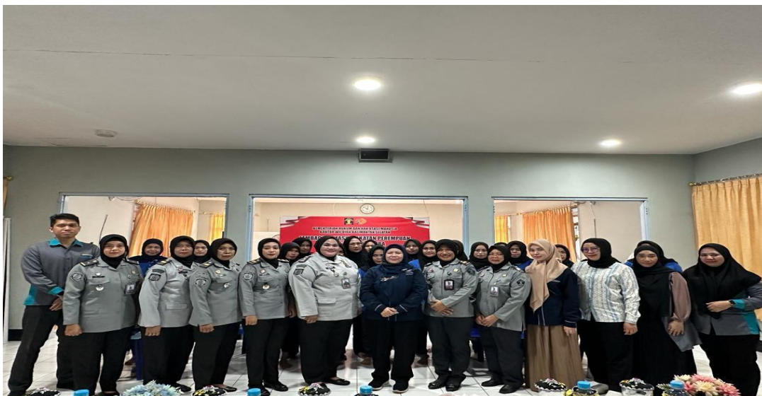
Foto 2. Bersama peserta pelatihan dan tim serta instruktur