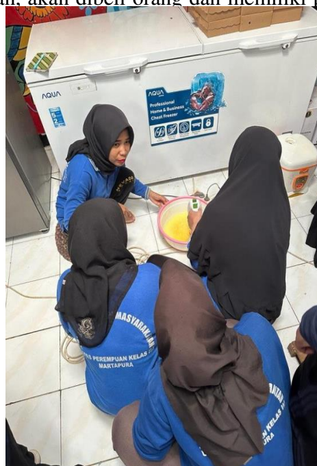
Foto 3 & 4. Peserta langsung berpraktek dengan dibimbing instruktur