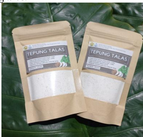
Gambar 2. Produk Tepung Talas

Produk luaran dari program ini adalah berupa produk tepung talas yang dapat dijadikan rekomendasi UMKM di Desa Suci, Kabupaten Jember. Berikut merupakan gambaran produk tepung talas.