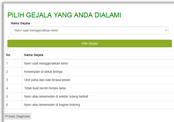
Gambar 3 Tampilan Pemilihan Gejala

Pada bagian pemilihan gejala, ditampilkan sesuai dengan jumlah gejala yang telah diinput pada form gejala. Dalam kasus ini terdiri dari 13 gejala. Pengguna dipersilahkan memilih gejala yang dialaminya. Setelah selesai memilih gejala yang dialami maka pengguna dapat melanjutkan proses dengan mengklik tombol Proses. Adapun fungsi - fungsi dari tombol yang terdapat dalam form yaitu :