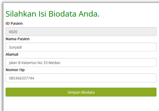
Gambar 2 Tampilan Awal Form Diagnosa