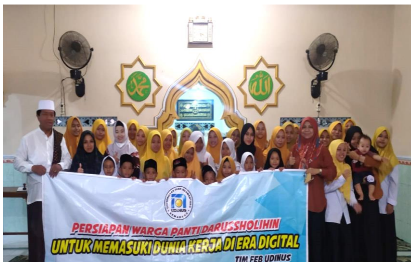
Gambar 5. Praktik Team Building

Tahap keempat adalah evaluasi. Evaluasi diberikan dengan menjelaskan kesalahan-kesalahan yang dilakukan saat praktik di tahap ketiga. Selain itu pemberian yang tidak tepat dalam melakukan praktik public speaking dengan pemberian kiat-kiat atau strategi-strategi untuk dapat berbicara di depan umum dengan penuh percaya diri. Evaluasi dalam team building adalah penjelasan cara menjaga hubungan kerja tetap harmonis, solid dan kondusif di tempat kerja. Selain itu juga penyampaian strategi-strategi agar kelompok atau tim dapat menjalankan perannya masing-masing sesuai dengan visi dan misi di tempat kerja. Narasumber juga memberikan kesempatan kepada warga panti asuhan Darussholihin untuk memberikan umpan balik tentang pelatihan yang telah diberikan oleh narasumber. Para peserta mengaku pengetahuan dan pemahamannya meningkat setelah mengikuti sesi pelatihan public speaking untuk meningkatkan rasa percaya diri terutama nanti saat digunakan untuk wawancara kerja. Para peserta juga antusias dengan permainan atau game untuk membentuk team building yang solid dan kondusif. Para peserta yakin bahwa pelatihan team building dan public speaking akan meningkatkan keterampilan soft skill dengan latihan secara terus-menerus akan membuat rasa percaya diri yang tinggi dan meningkatkan kompetensi pribadi sehingga tercipta personal branding yang kuat untuk memasuki dunia kerja.