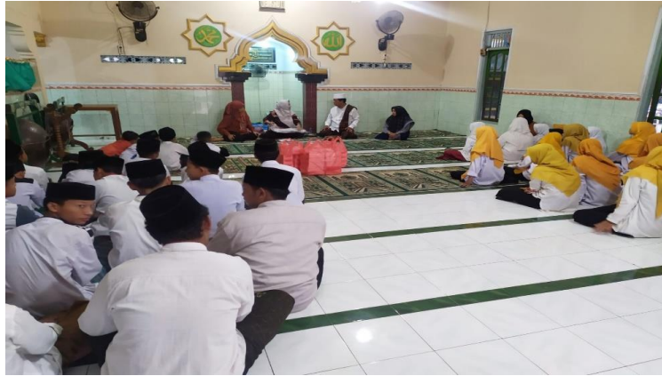
Gambar 2. Pengenalan Materi Team Building