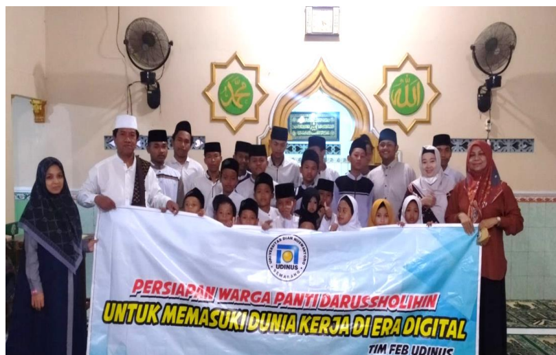
Gambar 4. Praktik Public Speaking

Tahap ketiga adalah praktik. Pada tahap ini, semua peserta dituntut untuk berpartisipasi dalam permainan atau game untuk membentuk team building. Sedangkan untuk praktik public speaking dengan meminta beberapa peserta untuk maju ke depan menyampaikan informasi kepada peserta lain dengan durasi berbicara di depan umum selama 5 menit setiap peserta. Praktik public speaking bertujuan agar warga panti asuhan Darussholihin berani dan percaya diri dalam berkomunikasi untuk menyampaikan pendapat dan informasi pada saat kerja nanti. Tahap ketiga dapat dilihat pada Gambar 4 dan Gambar 5 berikut ini :