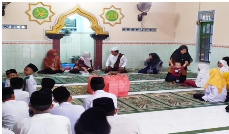
Gambar 3. Pengenalan Materi Public Speaking

Tahap ketiga adalah praktik. Pada tahap ini, semua peserta dituntut untuk berpartisipasi dalam permainan atau game untuk membentuk team building. Sedangkan untuk praktik public speaking dengan meminta beberapa peserta untuk maju ke depan menyampaikan informasi kepada peserta lain dengan durasi berbicara di depan umum selama 5 menit setiap peserta. Praktik public speaking bertujuan agar warga panti asuhan Darussholihin berani dan percaya diri dalam berkomunikasi untuk menyampaikan pendapat dan informasi pada saat kerja nanti. Tahap ketiga dapat dilihat pada Gambar 4 dan Gambar 5 berikut ini :