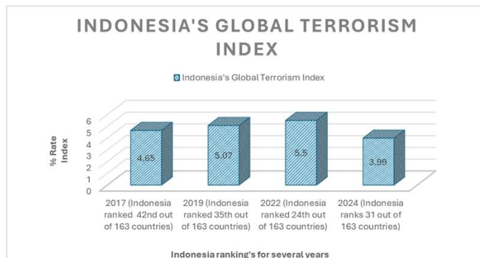
*Grafik dibuat oleh Penulis, disusun berdasarkan data dari Global Terrorism Index (2017, 2019, 2022, 2024)

Pada rentang tahun tersebut ditelusuri lebih lanjut dari keterangan Kepala BNPT Mohamed Rycko Amelza Dahniel menerangkan tidak ada aksi teror ( Zero Attacks ) apapun dari kurun waktu Juni 2023- Juni 2024. (Nugraha & Meiliana, 2024)