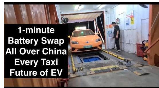
Gambar 3.5 Penerapan Swab Baterai pada Mobil Listrik di negara Cina