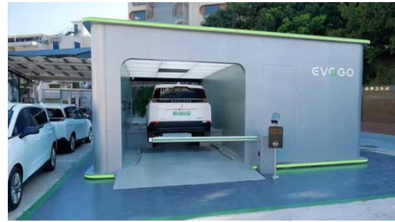
Gambar 3.6 Ilustrasi SPKLU dengan SWAB Baterai untuk kendaraan Listrik