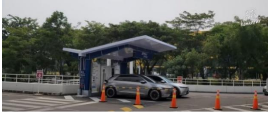
Gambar 3.3 Foto Lokasi SPKLU di Lahan Parkir