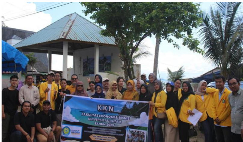
Gambar Foto Kegiatan