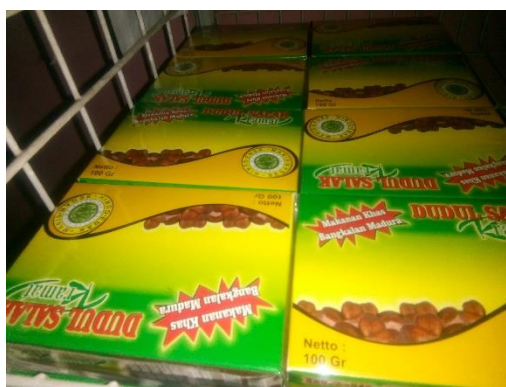
Gambar 2. Desain Produk UMKM Kelompok Tani Ambudi Makmur

Pemasaran tradisional ini memang benar adanya dengan dibuktikan dari segala macam aspek yang ada pada UMKM Kelompok Tani Ambudi Makmur, hal ini diawali dengan desain produk yang sangat monoton dapat dilihat pada gambar 2.