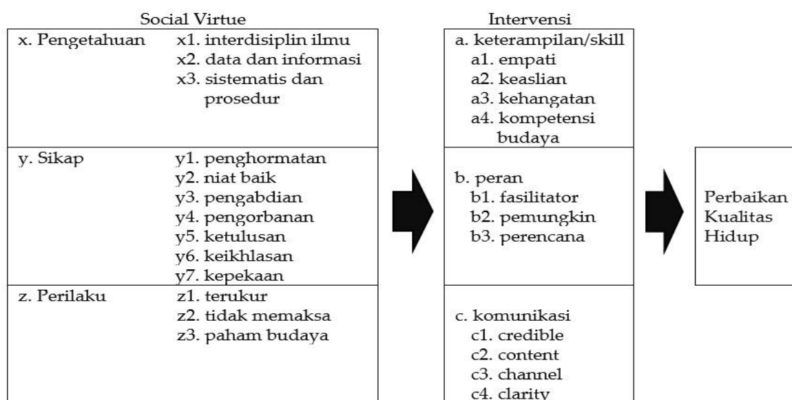
Gambar 1. Kerangka Konseptual Pemberdayaan Klien Berbasis “Social Virtue”