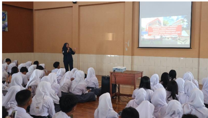
Gambar 3 Penyampaian Materi Perpajakan

Pemberian materi mengenai Undang-Undang Nomor 7 Pasal 2 Tahun 2021 Tentang Harmonisasi Perpajakan dilakukan selama 60 menit. Para siswa peserta sosialisasi sangat antusias sekali dengan materi yang disampaikan,