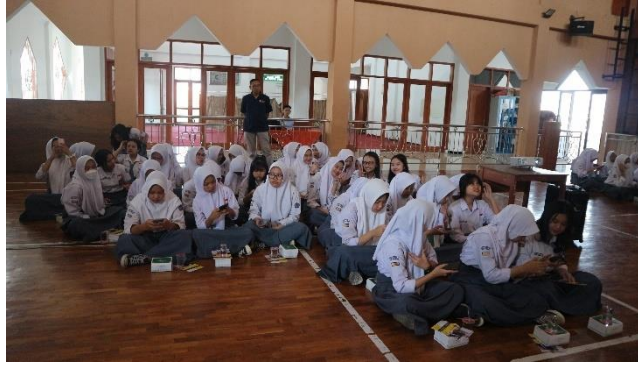
Gambar 5 Pelaksanaan Post Test