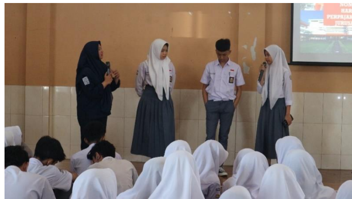
Gambar 4 Diskusi dan Tanya Jawab

Setelah penyampaian materi mengenai perpajakan dilanjutkan dengan sesi diskusi dan tanya jawab. Siswa dan siswi pada saat diskusi dan tanya jawab sangat antusias sekali. Hal ini ditandai dengan banyaknya pertanyaan yang disampaikan.