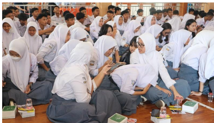
Gambar 2 Pelaksanaan Pre Test

Sebelum dimulai kegiatan PKM, siswa dan siswi peserta sosialisasi perpajakan diberikan pre test tujuannya adalah untuk mengetahui sejauh mana pemahaman siswa terkait materi perpajakan. Soal pre test diberikan dalam bentuk google form .