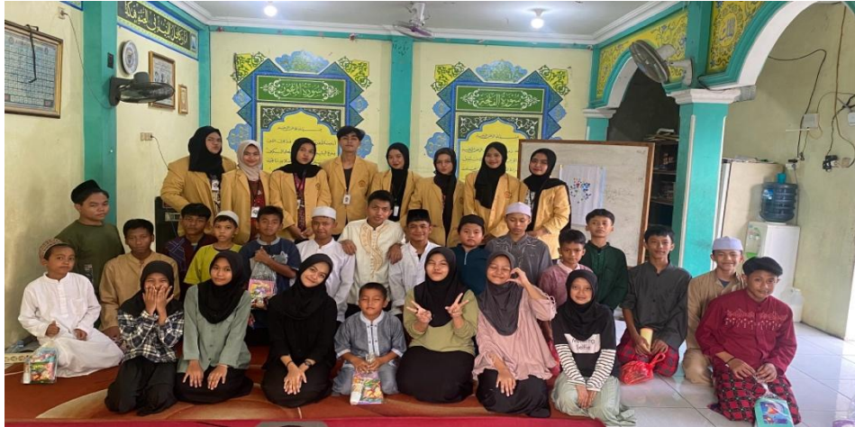
Gambar 3. Dokumentasi Kegiatan Pengabdian Masyarakat di Panti An-Nuur

al., 2021). Hal serupa dapat ditemukan pada kegiatan pengabdian yang menitikberatkan pada penguatan human resource generasi muda, dimana dalam kondisi bagaimanapun tak mengenal keterbatasan fisik tetap mengikuti perubahan zaman dengan berkarya serta berinovasi memperhatikan alam, kehidupan sosial dan teknologi yang ada (Martoyo et al., 2024; Setyahuni et al., 2024). Adapun bentuk produk dari kegiatan ini dapat dilihat pada gambar 2.