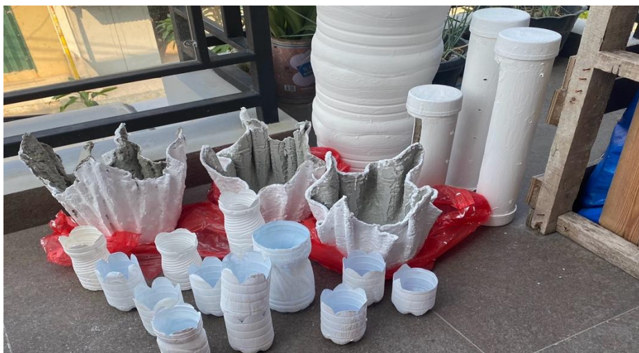
Gambar 2. Produk Kegiatan Pengabdian Masyarakat

Kegiatan pengabdian ini membentuk sikap resilience guna membantu anak-anak dalam menghadapi tekanan dan tantangan hidup, baik itu dari faktor internal seperti perasaan cemas dan takut, maupun faktor eksternal seperti perubahan lingkungan atau masalah sosial. Anak yang memiliki ketahanan mental yang baik lebih mampu mengelola stres, menghadapi kegagalan dengan lebih positif, dan mengembangkan solusi kreatif untuk masalah yang mereka hadapi. Selain itu, anak yang resilient cenderung memiliki rasa percaya diri yang lebih tinggi, yang merupakan elemen penting dalam pembentukan identitas diri yang sehat. Pentingnya mengembangkan resilience sejak dini tak bisa dipandang sebelah mata. Anak-anak yang dibekali dengan ketahanan mental akan mampu menanggulangi stres dan masalah yang datang, yang tentunya sangat penting di dunia yang semakin kompleks dan penuh tekanan ini. Oleh karena itu, pendidikan yang menekankan pada pengembangan resilience sejak dini akan sangat membantu anak-anak dalam mempersiapkan diri untuk menghadapi tantangan di masa depan (Burhamzah et al., 2023; Yohamintin, 2023).