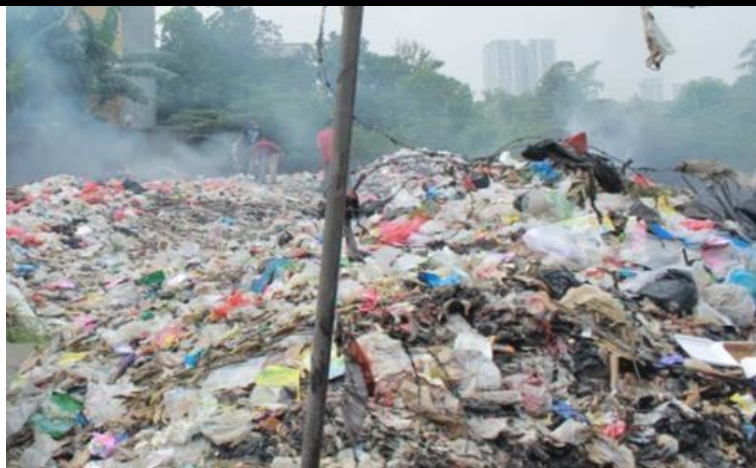
Gambar 2. Tumpukan sampah setelah melakukan survey

Peneliti menyusun program kerja Pengabdian Masyarakat di Desa Pasirsari, yakni kegiatan yang dilakukan secara offline dan online dengan tema “ Trash for Cash , Meningkatkan Ekonomi Kreatif dengan Pengolahan Sampah”. Kegiatan dilakukan di Aula Desa Pasirsari dengan mematuhi protokol kesehatan. Selain itu, kegiatan juga dilakukan secara online menggunakan zoom . Sebelum acaraterselenggara peneliti mempublikasikan pamflet acara secara online.