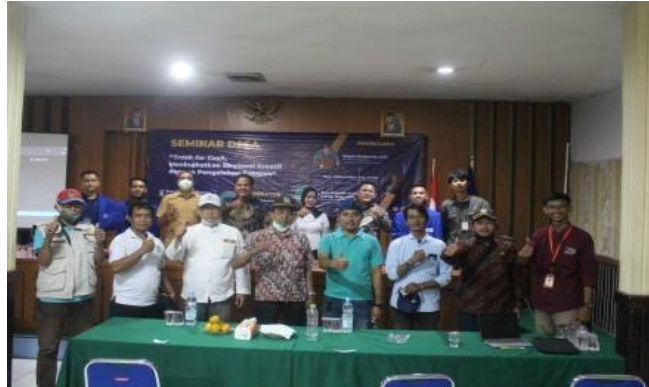
Gambar 3. Kegiatan Pengabdian Masyarakat

daur ulang dan sampah yang tidak dapat didaur ulang, sampah dikatakan bernilai ekonomi kreatif jika memiliki 4 poin, yakni (1) jumlahnya banyak, (2) terus menerus, (3) bernilai ekonomi, dan (4) dukungan dari pemerintah. Permasalahan sampah menjadi tanggung jawab seluruh lini masyarakat dan juga pemerintah.