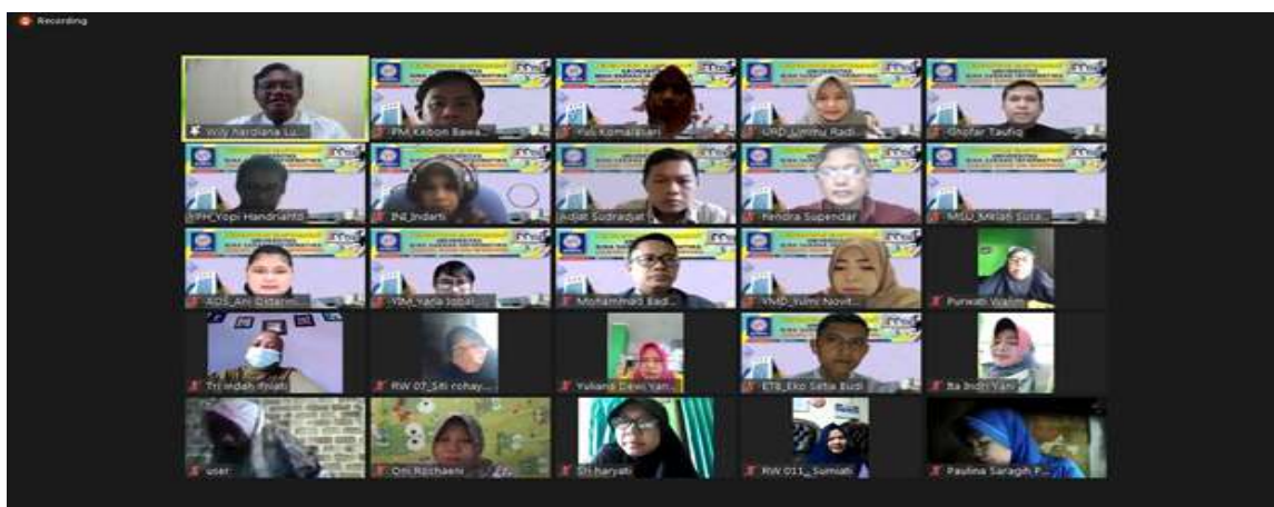
Gambar 2. Pelatihan dimulai