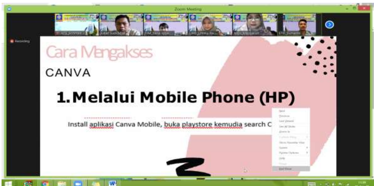
Gambar 4. Pengenalan aplikasi Canva melalui Mobile Phone