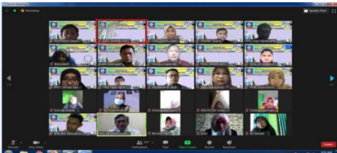
Gambar 1. Pembukaan Pengabdian Masyarakat