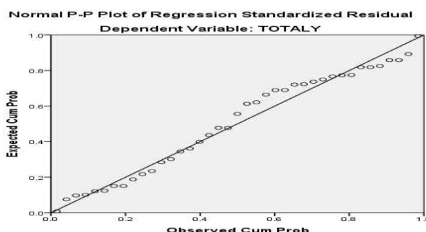
Gambar 1 Hasil Uji Normalitas