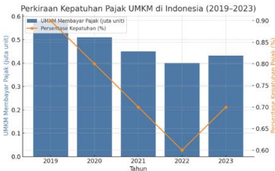
Gambar 1. Grafik Perkiraan Kepatuhan UMKM 2019-2023 Sumber : DJP dan Ikatan Konsultan Pajak Indonesia (IKPI, 2023)

Berikut ini adalah perkiraan kepatuhan Pajak UMKM di Indonesia Tahun 2019 – 2023.