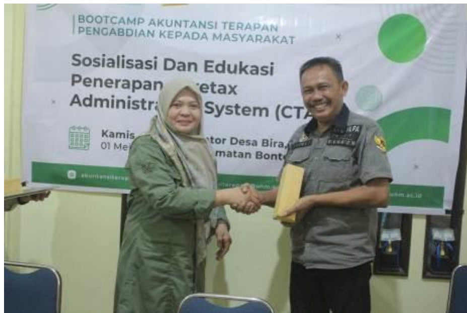
Gambar 5. Pendampingan Komunitas UMKM Desa Bira SADAR PAJAK

Luaran dari kegiatan ini menjadi indikator keberhasilan program. Hasil yang tampak antara lain meningkatnya pemahaman dan kesadaran pajak di kalangan pelaku UMKM, yang terlihat dari kemampuan mereka menjelaskan kembali dasar dasar perpajakan, perhitungan dan proses pelaporan melalui sistem digital CTAS. Selain itu, sebagian peserta mulai menunjukkan inisiatif untuk mendaftarkan usahanya secara formal dan mencoba menggunakan layanan Coretax untuk administrasi pajak. Disisi lain, keberlanjutan dari kegiatan pengabdian ini juga bersinergi, karena munculnya inisiatif membentuk komunitas UMKM sadar pajak di Desa Bira menjadi luaran konkret yang memperkuat keberlanjutan program.