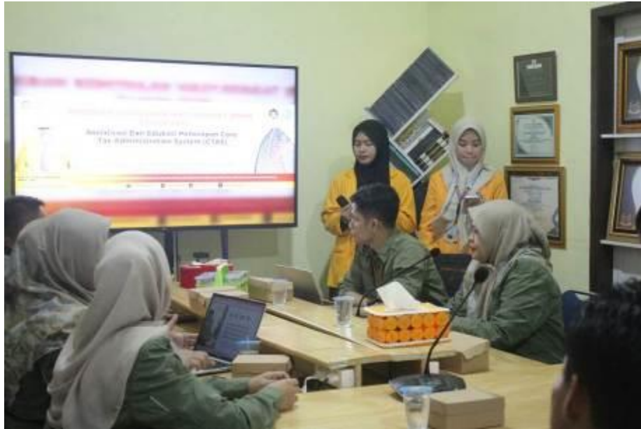
Gambar 3. Sosialisasi Literasi Perpajakan dan