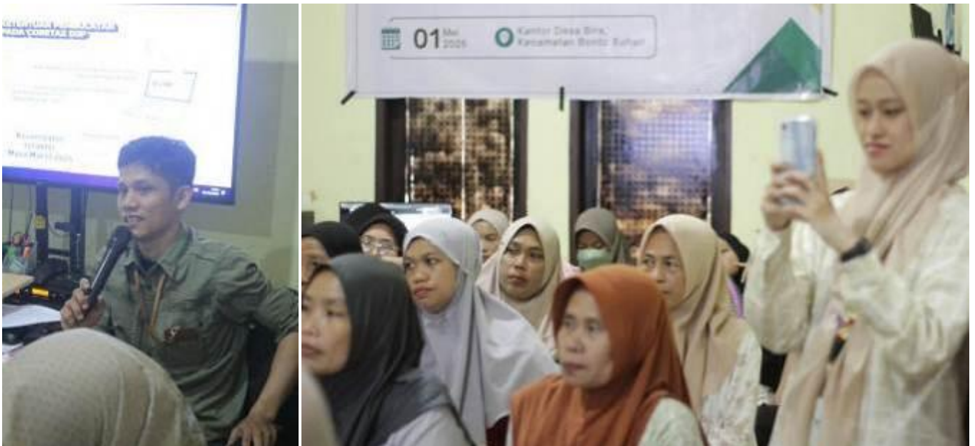
Gambar 4. Sesi Pelatihan CTAS dan Pendampingan

Pada tahapan ini, peserta sudah bisa menghitung pajak pribadi secara mandiri, melaporkan secara online dimulai dari login mandiri hingga mengunduh hasil laporan pajak mandiri. Pemaparan CTAS dilakukan dengan pendekatan partisipatif dimana peserta lebih interaktif untuk menyampaikan masalah terkait dengan tata cara pembuatan NPWP, cara aktivasi akun wajib pajak melalui akun