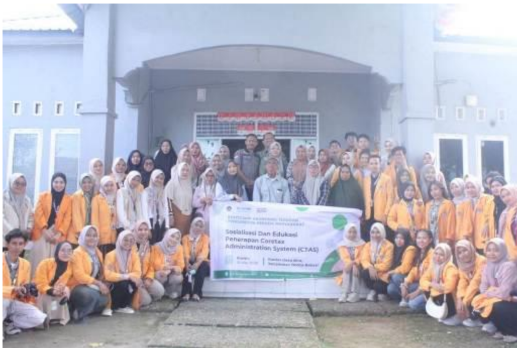
Gambar 6. Dokumentasi Akhir Kegiatan PKM

Secara keseluruhan, implementasi program ini menunjukkan bahwa edukasi pajak berbasis digital melalui penerapan Coretax dapat menjadi solusi efektif untuk meningkatkan literasi, kepatuhan, dan partisipasi pajak di tingkat lokal. Keberhasilan ini diharapkan dapat menjadi model pemberdayaan berkelanjutan yang mampu memperkuat posisi UMKM sebagai penggerak ekonomi sekaligus kontributor pembangunan nasional melalui pajak.